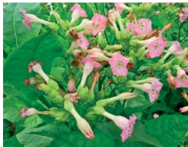
Slika 11. ► Biljka duhana (32)

Drogu u farmaceutskoj i općoj uporabi čine osušeni listovi kultiviranog duhana. Pri sušenju i fermentaciji listovi poprimaju zlatnožutu boju. Sadrže alkaloid nikotin te druge srodne alkaloidne nastale iz nikotinske kiseline (9). Primjenjuju se u obliku cigareta i cigara ili se podvrgavaju postupku ekstrakcije alkaloida.