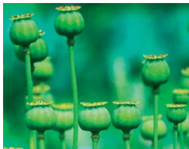
Slika 6. ► Nezreli tobolci maka (20)

Endogeni agonisti κ opioidnih receptora, dinorfini, identificirani su kao terapijska meta u borbi protiv ovisnosti. Tvari koje uzrokuju ovisnost u mozgu povećavaju razinu dopamina u centru za osjet nagrade pa korisnici osjećaju euforiju. Zbog toga