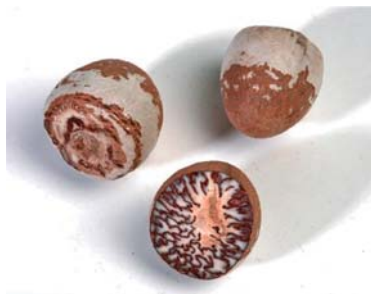
Slika 8. ► Sjemenke areke (25)

Upotreba areke izaziva ovisnost uz razvijanje tolerancije, a simptomi ustezanja slični su onim kod amfetamina te obuhvaćaju nesanicu, promjene raspoloženja, iritabilnost i