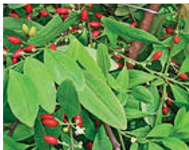
Slika 10. ► Kokaovac s plodovima (29)

List kokaovca, Folium coca , sadrži niz ekgoninskih alkaloida, a kokain čini do 50 % ukupnih alkaloida. Cijela skupina lokalnih anestetika nosi sufix -kain po uzoru na kokain, jedan od prvih otkrivenih lokalnih anestetika. Danas se rijetko koristi u medicinske svrhe, isključivo kao galenski pripravak u oftalmologiji i otorinolaringologiji. Kokain je vrlo popularna ulična droga i jedno od najčešćih sredstava ovisnosti. Primjenjuje se uglavnom nazalno, zatim intravenski i pušenjem. U