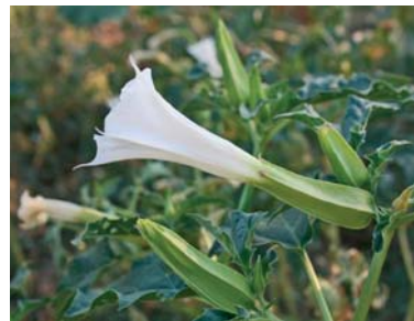
Slika 4. ► Kužnjak (13)

Vrste roda Datura L. primjenjuju se kao halucinogeni u obredima diljem svijeta. Cijela biljka, a osobito listovi i sjemenke, sadrži tropanske alkaloide. Omjer tropanskih alkaloida je različit od onog u velebilju pa je različito i djelovanje – izraženiji je depresorni učinak na središnji živčani sustav (9). Niže doze uzrokuju blagi kolinergički delirij koji traje od 8 do 12 sati, a veće doze euforiju, nadnaravnu interakciju sa svijetom, slušne halucinacije i paranojne deluzije koje mogu potrajati čak 3 dana (5). Skopolamin prati i zlokobno ime »zombi droga«, jer uzrokuje amneziju i submisivno ponašanje pa je često u pozadini pljački i seksualnih zločina, osobito u Južnoj Americi (14).