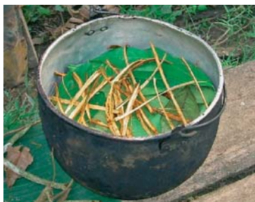
Slika 1. ► Biljni materijal za pripremu ayahuasce u kotlu (6)

Ayahuasca je naziv za napitak koji se koristi u religioznim obredima raznih plemena Južne Amerike. Suvremena upotreba je značajno proširena te više nije ograničena na rituale. Napitak se pripravlja kuhanjem biljnog materijala (slika 1.), a za njegovu izradu koristi se do 90 biljnih vrsta (1). Sastojak koji se gotovo uvijek pojavljuje je vrsta Banisteriopsis caapi (Spruce ex Griseb.) C. V. Morton, Malpighiaceae, povijuša podrijetlom iz Amazone. Izdanci i kora ove biljke sadrže β-karbolinske alkaloide, harmin, harmalin i tetrahidroharmin. Takozvani harmala alkaloidi, snažni su inhibitori monoamino oksidaza (MAO) i serotoninских prijenosnika, te na sluznicama sprječavaju razgradnju bioaktivnih amina (5). Ayahuasca često sadrži dimetiltriptamin (DMT), indolski alkaloid, koji se primijenjen oralno intenzivno metabolizira, a bez istodobne primjene s MAO inhibitorima ne djeluje psihoaktivno (1). Izvor DMT-a su listovi vrste Psychotria viridis Ruiz & Pav., Rubiaceae, ali i kore korijena raznih vrsta porodice Fabaceae, poput vrste Mimosa hostilis (Willd.) Poir. (5).