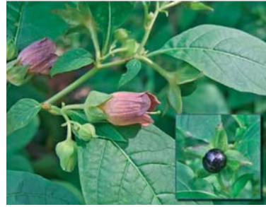
Slika 3. ► Velebilje (12)

U farmaciji se primjenjuju list velebilja, Folium belladonnae , i korijen velebilja, Radix belladonnae . Sadrže tropanske alkaloide: hiosciamin, atropin i skopolamin. Na tržištu su dopušteni isključivo pročišćeni alkaloidi u gotovim formulacijama zbog izrazito uske terapijske širine. Nuspojave terapijskih doza uključuju crvenilo kože, proširenje zjenica, zadržavanje urina, smanjeno lučenje slina i suhoću usta, teškoće kod gutanja i govora, konfuziju i nemir (9). Pri višestruko višim dozama, ti su alkaloidi delirijanti, uzrokuju antikolinergički toksični sindrom ili antikolinergički delirij. Karakteriziran je nepovezanim govorom, nemirom, dezorijentacijom, deluzijama i halucinacijama. Naknadno nastupaju amnezija i depresija, a mogu biti isprekidane maničnim i često agresivnim stanjima (5). U slučaju velebilja, do trovanja najčešće dolazi slučajno. Plodovi su naročito opasni zbog primamljivog izgleda (slika 3.).