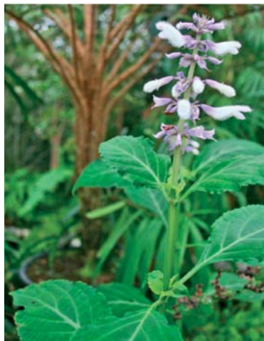
Slika 7. ► Božanska kadulja (22)