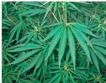
Slika 5. ► Indijska konoplja (17)

Indijska konoplja, Cannabis sativa L. subsp. indica (Lam.) E. Small et A. J. Cronquist, Cannabaceae , jednogodišnja je zeljasta biljka podrijetlom iz južne Azije. Listovi su dlanasti i sastavljeni, građeni od 5 do 7 ili više lisaka (slika 5.). Biljka je dvodomna, cvjetovi su neugledni i oblikovani u metličasti cvat (17). Kod nas, kao i u drugim europskim zemljama, isključivo se uzgaja. Droga, Herba cannabis indicae , predstavlja smolom bogate vršne cvatuće dijelove ženske biljke s nešto plodova i listova. Droga, u smislu zloupotrebe, poznata je kao marihuana, naziv je nastao u Meksiku od imena Maria Juana (8). Do danas, otkriveno je preko 100 kanabinoida u smolama vrsta roda Cannabis L., a zajedno s prisutnim terpenima uzrokuju niz psihoaktivnih i ostalih učinaka na ljudski organizam. Osnova psihoaktivnog učinka je vezanje \Delta^9 tetrahidro-