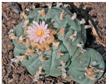
Slika 2. ► Pejotl kaktus (11)

Pejotl sadrži niz alkaloida nastalih iz aminokiseline fenilalanina, od kojih je meskalin najzastupljeniji i čini od 5 do 7 % mase dugmeta dok ostalih alkaloida ima oko dvadeset puta manje (9). Meskalin je agonist serotoninskih i dopaminskih receptora. Do prvih znakova intoksikacije, poput vrtoglavice i povraćanja, dolazi 30 minuta nakon primjene.