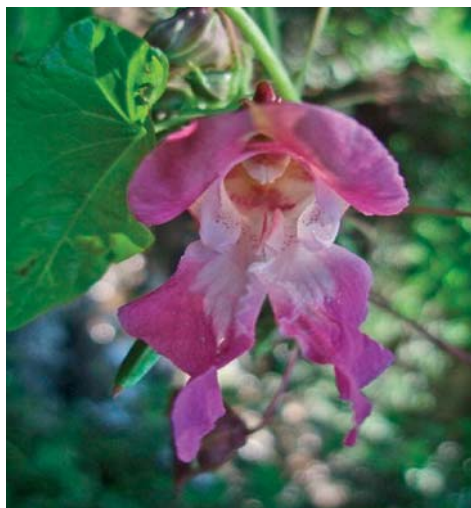
Slika 1. ► Cvijet vrste I. glandulifera

Učinak na modelu boli je izostao uz usporednu primjenu naloksona što upućuje na uključenost opioidnog sustava, dok je anksiolitički učinak povezan s utjecajem ekstrakta na monoaminske neurotransmitere i moždane čimbenike rasta (5). Jedan od flavonoida, amelopsin, odnosno dihidromiricetin, pronađen u cvjetovima vrste I. glandulifera , klinički se ispituje zbog utjecaja na kontrolu glikemije, inzulinske otpornosti te izlučivanje inzulina u bolesnika s dijabetesom tipa 2 (6). Osim spomenutih fenolnih spojeva, za svojite roda Impatiens karakteristični bioaktivni spojevi su naftokinoni, polisaharidi te saponini (7). Cilj ovog rada bio je odrediti polifenole, flavonoide i antioksidativni učinak ekstrakata listova i cvjetova vrsta I. glandulifera i I. balfourii .