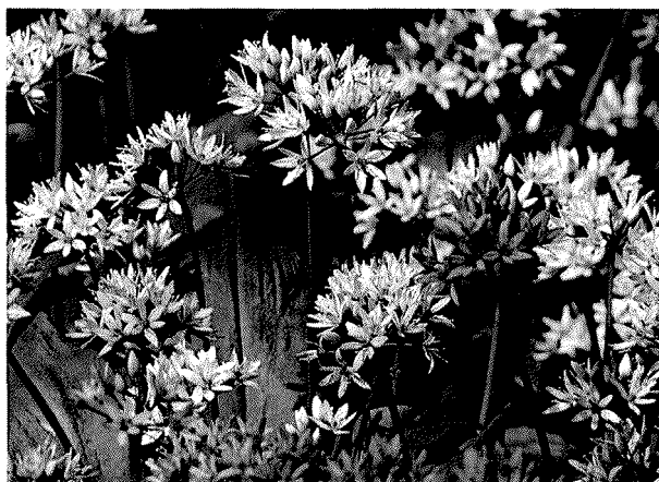
Slika 1. Medvjedi luk, Allium ursinum L. (6)

Pripada porodici Amaryllidaceae (5, 7), a pojavljuje se u Europi i Sjevernoj Aziji. Raste u našim šumama i može ga se naći pojedinačno ili u velikim skupinama. Dobrom rastu pogoduje vlažno tlo i humusom bogate bjelogorične šume uz potoke i šumske putove. Rod Allium obuhvaća otprilike 700 vrsta od čega se svega nekoliko koristi kao ljudska hrana. U bližoj povijesti, pozitivan učinak kultiviranih vrsta (luk, češnjak, poriluk) na zdravlje je sve više i više postao tema rasprava, kao i učinak nekoliko pripravaka koji se primjenjuju kao fitofarmaceutici. Osim toga neke samonikle vrste tog roda se koriste u prehrani, uglavnom kao ljekovito ili začinsko bilje (5, 8–10). Najkarakterističnije sastavnice medvjedeg luka su spojevi koji sadrže sumpor, od kojeg potječe