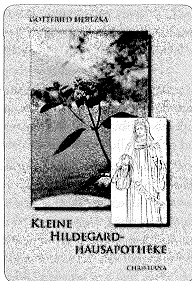
Slika 4. Naslovnica knjige: Hertzka G. Kleine Hildegard-Hausapotheke . Stein am Rhein: Christiana – Verlag, 2003.

Hildegarda, poput alkemičara srednjega vijeka, uz ljekovito bilje opisuje i uporabu dragog kamenja i minerala. Preporučuje zlato za artritis, smaragd za bolesno srce, jaspis za hunjavicu (izazvanu mirisom sijena) i srčanu aritmiju, zlatni topaz za slabljenje vida, plavi safir za upalu očiju. Opisuje pripremu vina od dragog kamenja sličnu tinkturama. Obilježja što ih pripisuje dragome kamenju vrlo su slična opisima u ajurvedskoj medicini. Također spominje i korištenje pojedinih životinjskih dijelova kao što je balzam od jelenje masti i pelina za liječenje artritisa ili jazavčevo krzno za ublažavanje bolova u leđima.