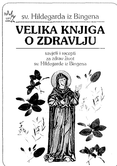
Slika 5. Naslovnica knjige: Breindl E. Velika knjiga o zdravlju . Đakovo: Karitativni fond UPT »NE ŽIVI ČOVJEK SAMO O KRUHU«, 2003.