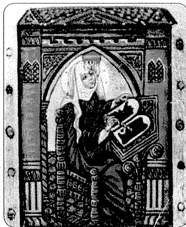
Slika 1. Sveta Hildegarda iz Bingena, preuzeto iz knjige: Hertzka G. Čudo Hildegardine medicine . Đakovo: Karitativni fond UPT »NE ŽIVI ČOVJEK SAMO O KRUHU«, 1999.

Sveta Hildegarda iz Bingena (slika 1.) jedna je od najvećih mističarki i proročica srednjega vijeka. Bila je iznimno kreativna i hrabra žena. Dala je svoj doprinos na području teologije,