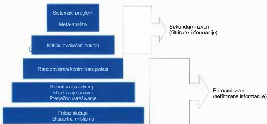
Slika 2. Hijerarhija dokaza (objašnjenje pojmova vezano uz sliku 2.)

Sustavni pregled (engl. Systematic review ) predstavlja sintezu rezultata više studija koje su istraživale iste parametre.