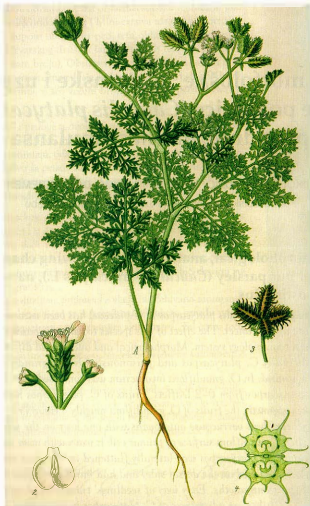
Slika 1. Podlanica – Caucalis platycarpus L. (prema Thome-u 1885).

zultat stimulacije imunološkog sustava domaćina tumora. U obliku čaja, droga podlanice ( herba caucalidis ), prisutna je i na tržištu farmaceutskih proizvoda kao prirodni lijek.