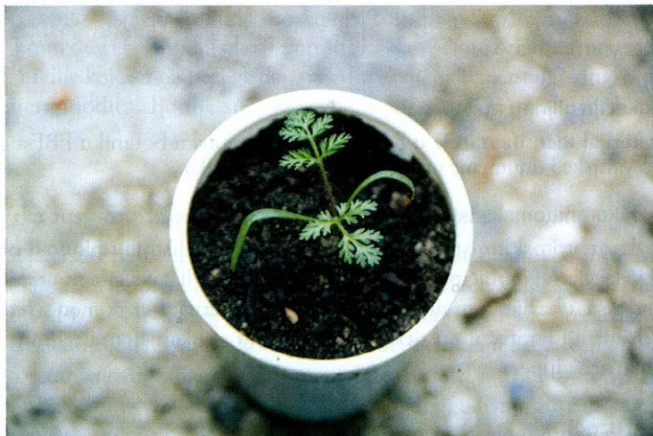
Slika 3. Trostruko rasperani prvi pravi listovi u podlanice.

nom bojom i slabije sjajnom epidermom. U podlanice je dužina krajnjih isperaka (liske trećeg reda) do 2 puta veća od širine, a u velevjetne moračine 3 i više puta. S donje strane liski u podlanice (slika 4a) se nalazi veći broj jednostavnih, jednostaničnih dlaka dužine do 1 mm, a u velevjetne moračine (slika 4c) tek manji broj takvih dlaka koje su redo-