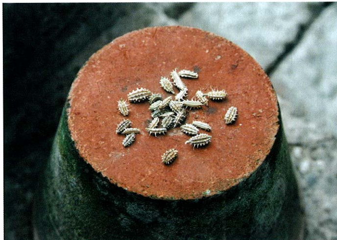
Slika 6. Zreli plodovi podlanice.

mo jedan niz bodlji, a u moračine jedan do dva niza. Na primarnim rebrima se u podlanice nalaze bradavičasta izbočenja s po jednom čekinjastom dlakom na vrhu, dok je u moračine površina primarnog rebra valovita s većim brojem sitnih čekinjastih dlaka. U nezrelim plodovima primarna rebra su zelena, a po dozrijevanju smeđa. Bodljaste izrasline su u početku zelenkasto žute, a kasnije blijedo žute i smečkaste. U nezrelim plodovima se u podlanice na vrhu nalaze kratki vratovi tučka koji svojom visinom ne prelaze ljuskaste lapove. Nasuprot tome u velecvtjetne moračine su vratovi tučka dugi i nitasti i svojom visinom više puta prelaze nitaste lapove. Ove dvije vrste znatno se razlikuju i po cvjetovima (10).