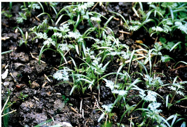
Slika 2. Podlanica u ranoj fazi razvitka s naglašeno dugim supkama.

U juvenilnom stadiju razvoja moguće je podlanicu zamijeniti s nekim drugim vrstama iz porodice štitarki kao što su Orlaya grandiflora , Daucus carota L., Scandix pecten veneris L.. Od njih se podlanica razlikuje u početku po najdužim supkama (slika 2), a zatim po trostruko rasperanim prvim pravim listovima (slika 3) s vrlo malo dlaka, sivkasto zele-