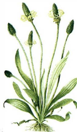
Slika 1. Plantago lanceolata L. – uskolisni trputac.

na biljne vrste Plantago lanceolata L. (uskolisni trputac, Slika 1.) s Digitalis lanata Ehrh. (vunasti naprstak, Slika 2.) (6). Prisustvo štetnih biljnih vrsta u biljnom lijeku najčešće je posljedica pogreške pri botaničkom raspoznavanju ili pak namjerne zamjene (patvorenja). Poznati primjer je belgijski slučaj atipične renalne fibroze zbog uzimanja proizvoda za mršavljenje u kojima je biljna vrsta Stephania tetrandra S. MOORE slučajno bila zamijenjena s vrstom Aristolochia fangchi WU (sadrži nefrotoksične i kancrogene aristolohne kiseline) (7). Opće je rašireno patvorenje esencijalnih ulja sa sintetskim spojevima (npr. vrlo toksičan cinamaldehyd umjesto esencijalnog ulja cimeta) ili jeftinijim uljima (npr. umjesto prave lavande ulje lavandina bogato neurotoksičnim kamforom) (8).