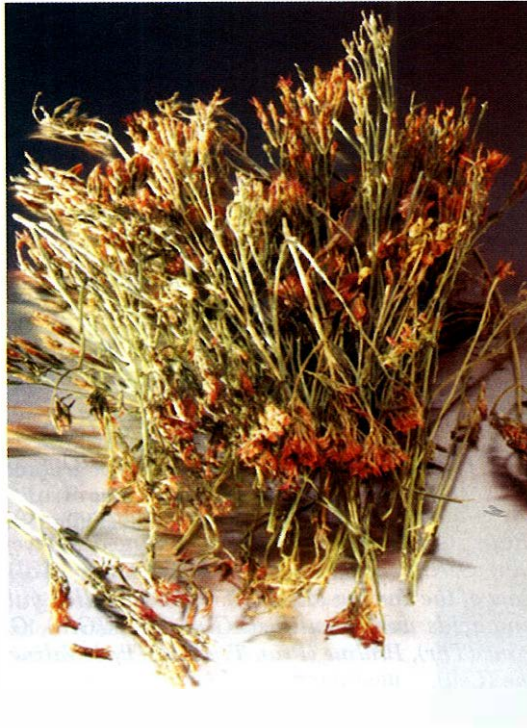
Slika 1.: Zeleni kičice ( Centaurii herba )