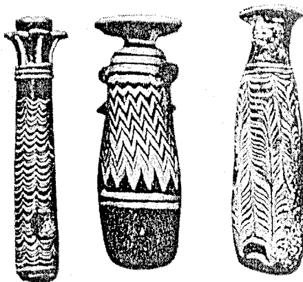
Slika 3. Bočice za šminku, Egipat, 700 god. p. Kr.

(3200 god. p. Kr., pisan babilonskim klinastim pismom) spominje se upotreba pigmenta ultramarina i mirisa iz bilja. I drugi antički narodi upotrebljavaju slična sredstva, a u nekih je razvijena i korektivna kirurgija, kao npr. u starih Indijaca: rinoplastika (za nadomještanje nosa) (9). U starim hinduskim svetim knjigama (Vede, 1500–500 god. p. Kr.), koje su pisane sanskrtom, opisuju se čak 2000 ljekovitih i mirisnih droga. Smatra se, da su Židovi tijekom svog izgnanstva u Egiptu naučili sve bitno o parfimeriji te o higijenskim i dekorativnim pripravcima. Tako se u Bibliji spominju kozmetička znanja u području stare Palestine. Navode se masti i ulja za masažu, mirisi, rumenila za lice, boje za obrve i trepavice te umjetni zubi (izrađivali su ih iz tvrda drveta, slonovače i zlata) (10).