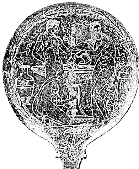
Slika 1. Poledina zrcala, Etrurija 400–300 god. p. Kr. (11)

Kozmetologija istražuje, pronalazi i metodološki primjenjuje utjecaje, zahvate i kozmetička sredstva koji-