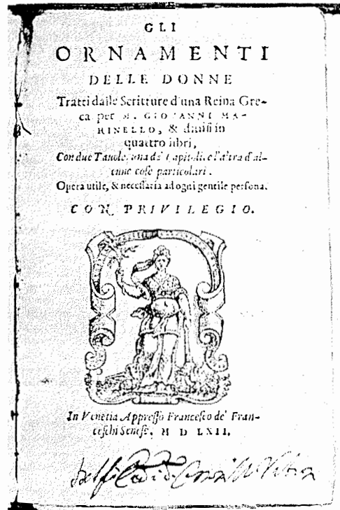
Slika 4. M. G. Marinelli: Ukrašavnje gospoda, Venecija 1562. god. Prva sačuvana knjiga o kozmetici na tlu Italije.(13)

U Europi već od IX. stoljeća djeluje visoka medicinska škola u Salernu, koja je bila preteča medicinskih fakulteta. Tu predaju brojni profesori kirurgije, fiziologije i drugih grana medicine te pišu znamenita djela. Za kozmetologiju je važna Trotula za koju se točno ne zna je li bila liječnica ili babica, ali se zna da je u prvoj polovici XII. stoljeća napisala djelo o ženskim bolestima »De passionibus mulierum«, a u njemu je dio posvetila kozmetici. Ona piše o izbjeljivanju i bojenju kose, uklanjanju bora i proširenih žilica te o liječenju usnica (5).