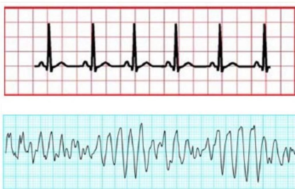
Slika 2. Usporedba torsades de pointes i normalnog sinus ritma (gornja slika prikazuje normalni sinus ritam, a donja torsades de pointes ) [preuzeto iz (8)]