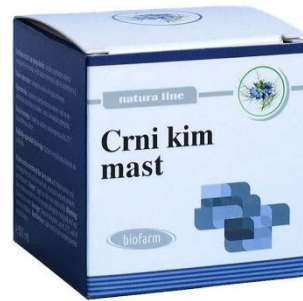
Slika 7. Crni kim mast