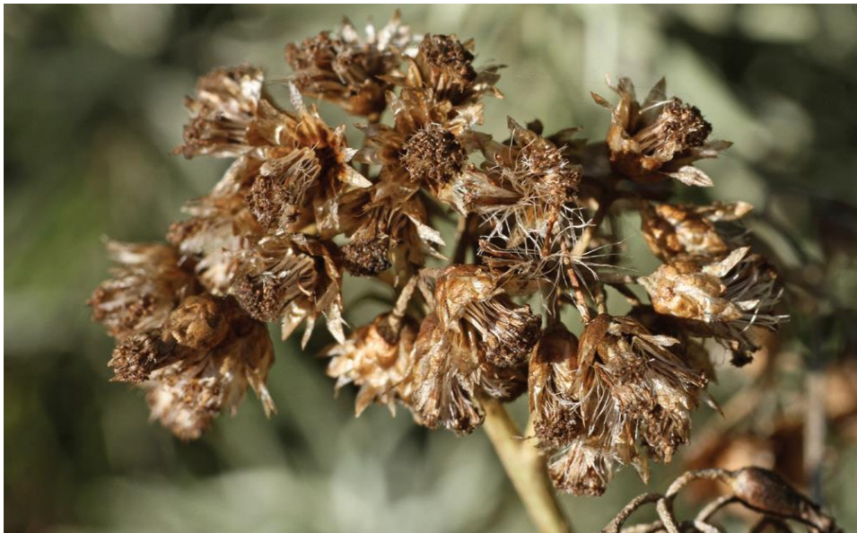
Slika 4: Plod primorskog smilja

Plod smilja je jednosjemena roška na čijem se vrhu nalazi kunadra, prilagodba u obliku rasperjanih dlaka koja služi rasprostranjivanju sjemenaka (Glavaš, 2019) (Slika 4).