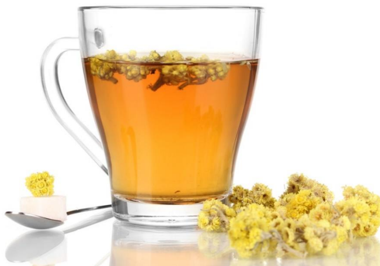
Slika 8: Čaj od cvjetova smilja

Na području Mediterana smilje je stoljećima korišteno kao tradicionalni lijek. Istraživanjem o upotrebi ljekovitog bilja na jadranskim otocima utvrđeno je da je smilje jedna od često korištenih ljekovitih biljaka (Łuczaj i sur., 2021). Zahvaljujući antimikrobnom, protuupalnom i antialergijskom učinku, primjenu najčešće pronalazi kod upalnih stanja kože, u terapiji upalnih i infektivnih stanja dišnih puteva kao što su bronhitis, laringitis, traheitits i kašalj te kod tegoba probavnog sustava, najčešće kao koleretik (Antunes Viegas i sur., 2014; Kuštrak, 2005). Infuzi (Slika 8), poznatiji kao čajevi, pripremaju se od cvjetova i listova smilja, a primjenu nalaze u terapiji simptoma prehlade i alergija. Dekokti se koriste u terapiji probavnih tegoba (Kramberger i sur., 2021a). Cvijet smilja nalazi se u čajnim mješavinama namijenjenima regulaciji rada jetre i žučnog mjehura ( www.ljekarna.hr ). Zabilježena je i primjena smilja kao sredstva za ublažavanje nesаницe i glavobolje (Kramberger i sur., 2021a).