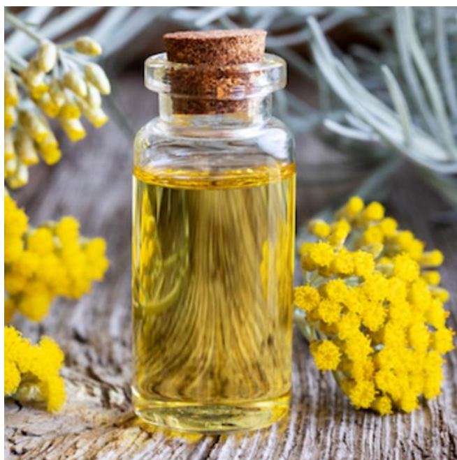
Slika 7: Eterično ulje smilja

čimbenicima (Ninčević i sur., 2019) kao što su izloženost suncu i nadmorska visina na kojoj biljka raste (Ćavar Zeljković i sur., 2015).