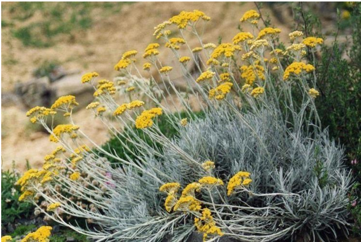
Slika 1: Grm primorskog smilja

Primorsko smilje (Slika 1), Helichrysum italicum (Roth) G. Don, pripada porodici glavočika, Asteraceae, i rodu Helichrysum kojeg čini više od 500 različitih vrsta na području Afrike, Azije, Europe i Australije. Smatra se da ime roda potječe od grčkih riječi “ helios ” i “ chryos ” koje u prijevodu znače „sunce“ i „zlatno“ (Perrini i sur., 2009). Smilje karakteriziraju cvatovi jarko žute boje koji zadržavaju svoj oblik i boju nakon sušenja. Neki od uobičajenih stranih naziva referiraju se na to svojstvo. Francuski naziv „ immortelle “, engleski „ everlasting “ i španjolski „ siempreviva “ u prijevodu znače besmrtni, odnosno vječan (Akaberi i sur., 2019). Iako ne ulazi u sastav curry mješavine, neki ga autori zbog aromatičnog mirisa nazivaju curry biljkom (Pohajda i sur., 2019.).