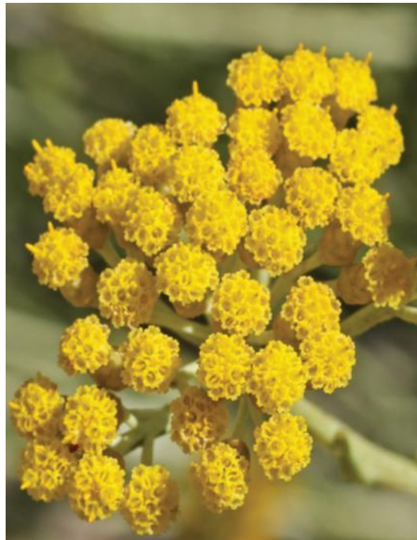
Slika 3: Cvat primorskog smilja