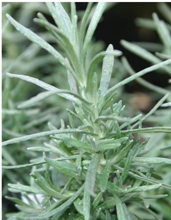
Slika 2: Listovi primorskog smilja

Smilje je vazdazeleni polugrm visine 20-50 centimetara (Glavaš, 2019). Razgranati podzemni izdanak, rizom, sa širokim nitima ksilema prodire duboko u tlo osiguravajući time brz protok vode i prilagodbu na sušne uvjete. Iz rizoma se svake godine razvijaju deseci stabljika koje nose cvijet (Pohajda i sur., 2019.) Uspravna stabljika, u osnovi drvenasta, obrasla je bijelim svilenkastim dlakama. Uski šiljasti listovi su na licu zeleni, a na naličju srebrno dlakavi i jako aromatični (Slika 2). Pri osnovi stabljike skupljeni su u rozetu, dok su ostali naizmjenično raspoređeni po stabljici (Savković, 2017). Debela kutikula i guste dlačice na naličju štite puči i smanjuju transpiraciju čime osiguravaju smilju prilagođenost na sušne uvjete staništa (Pohajda i sur., 2019.). Zlatnožuti cjevasti cvjetovi intenzivnog mirisa nalaze se na vrhu stabljike i skupljeni su u guste glavice koje izgledaju kao jedan cvijet (Slika 3). Glavice su skupljene u gronju. Smilje cvjeta od lipnja do kolovoza.