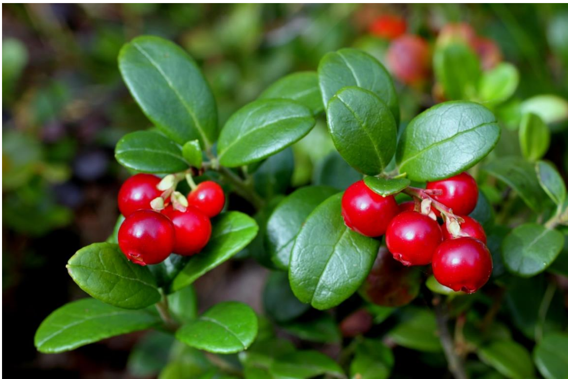
Slika 1. List i plod brusnice

Brusnica ( Vaccinium vitis-idaea ) je višegodišnji zimzeleni patuljasti grm. Spada u porodicu Ericaceae i u rod Vaccinium koji sadržava otprilike 150 različitih vrsta kao što su europske borovnice, sjevernoameričke borovnice, američke brusnice i dr. Kultivirane su sjevernoameričke borovnice, američke brusnice i brusnice iako se brusnice većinom skupljaju kao divlje (Padmanabhan i sur., 2016). Brusnice u prosjeku dosegnu visinu od 30 cm. Stabljika je uspravna, rijetko razgranata, drvenasta i dlakava. Listovi su naizmjenični, ovalni i obrnuto jajoliki, kratke peteljke, dugi 0.9 – 2.5 cm, kožasti i na vrhu su često zarežani. Lice lista je sjajno i tamno zeleno dok je naličje svijetlozelene boje i ima crne ili smeđe žlijezde koje izgledaju kao točkice. Rubovi su nazubljeni i pilasti, a nervatura se jasno očituje. Cvjetovi su sitni i zvonasti, bijele do ružičaste boje. Latice su pri dnu spojene, duge 5 – 8 mm i ima ih 4 u vjenčiću. Čaška se sastoji od 4 lapa. Jedan tučak je izbočen iz cvijeta, a prašnika ima 4 ili 8. Cvat je grozdasti. Cvatnja se događa u svibnju i lipnju, a sjeme dozrijeva od kolovoza do listopada. Plod je tamno crvene boje, okrugao, sjajan, sočan, jestiv i kiselog okusa ( www.luontoportti.com , www.landscapeplants.oregonstate.edu ).