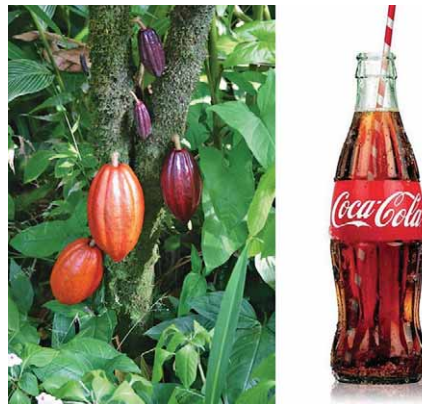
Slika 2. Izgled boce Coca-Cole inspiriran plodovima kakaovca (7)