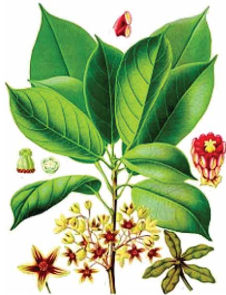
Slika 5. Cola acuminata (Pal. de Beauv.) Schott et Endl. (20)

Droga – Colae semen (slika 6.) (23) sastoji se od osušenih sjemenaka različitih Cola vrsta, osobito C. nitida i C. acuminata , i to uglavnom od usitnjenih supki, dok je sjemena lupina redovito uklonjena. Plodovi se skupljaju nedozreli,