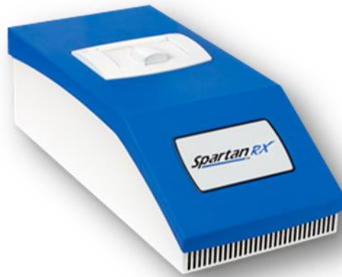
Slika 5: Analizator za CYP2C19 gen a

S druge strane, postoje i problemi koji usporavaju uvrštavanje farmakogenetike i farmakogenomike u rutinsku kliničku uporabu. Prvenstveni razlog su farmakogenetske smjernice koje zasad nisu dovoljno optimizirane, tj. ne pokazuju dovoljnu ekonomsku korist ili ne sadrže dovoljnu razinu dokaza. S obzirom da su cijene testova molekularne dijagnostike i do 100 puta veće od općih biokemijskih pretraga, teško je očekivati da će široki probir na teret zdravstvenog sustava moći biti ostvaren u bližoj budućnosti. Ostali problemi uključuju potrebu za obrazovanjem zdravstvenog osoblja kako bi ono moglo interpretirati rezultate. Problem je i vrijeme za izvedbu samog testa te standardizacija rezultata. Trenutno vrijeme koje je potrebno za izdavanje nalaza [eng. turnaround time (TAT)] nekog genetičkog testa jest ponekad i do mjesec dana, zbog čega bolesnicima s hitnim stanjima farmakogenetičko testiranje nije od koristi. Osim toga, donedavno nije bilo standardizirano ni iskazivanje rezultata, zbog čega je rezultate farmakogenetskog testiranja bilo teško uspoređivati između različitih laboratorija. Tek je prošle godine CPIC ostvario koncenzus kako bi se prilikom izdavanja rezultata rabili ujednačeni pojmovi. 121