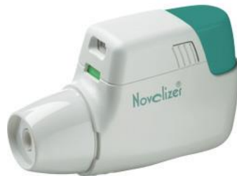
Slika 9. Novolizer