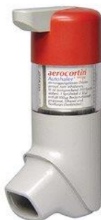
Slika 4. BAI (breath actuated inhaler)-autohaler

Autohaler-BAI (breath actuated inhaler) je tehnološki napredniji MDI zato jer eliminira potrebu koordinacije inhalacije i aktivacije lijeka. Takav inhaler se propisuje bolesnicima koji ne mogu ispravno koristiti klasičan MDI. On se aktivira udahom i ne ovisi o inhalatornoj snazi pacijenta (Vukić-Dugac, 2013).