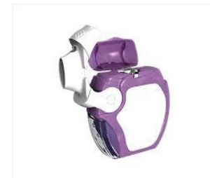
Slika 13. Forspiro