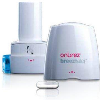
Slika 8. Breezhaler