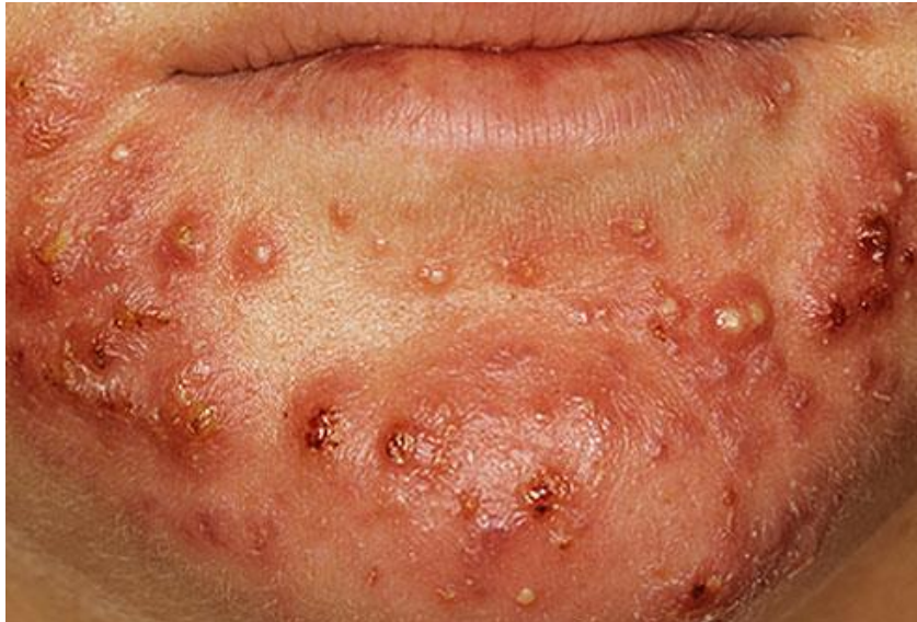
Slika 10. Teški oblik akni