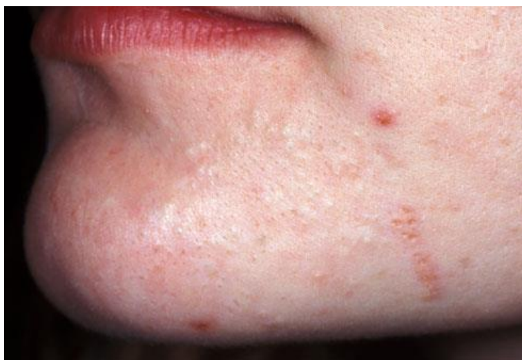
Slika 8. Blagi oblik akni (www.webmd.com)

** - lijekovi mogu biti propisani u fiksnoj kombinaciji ili kao odvojene komponente