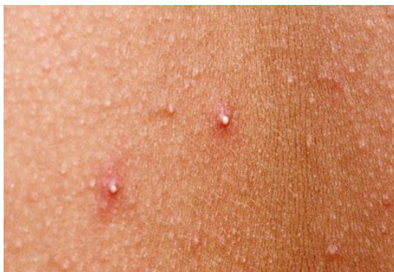
Slika 1. Zatvoreni komedoni ( whiteheads ) (www.webmd.com)

Zatvoreni komedon naziva se još whitehead (zbog bijelog vrha), veličine je 1-2 mm te se najbolje vidi kad je koža rastegnuta (Slika 1.). Predstavlja prvi klinički znak akni i ima tendenciju puknuti.