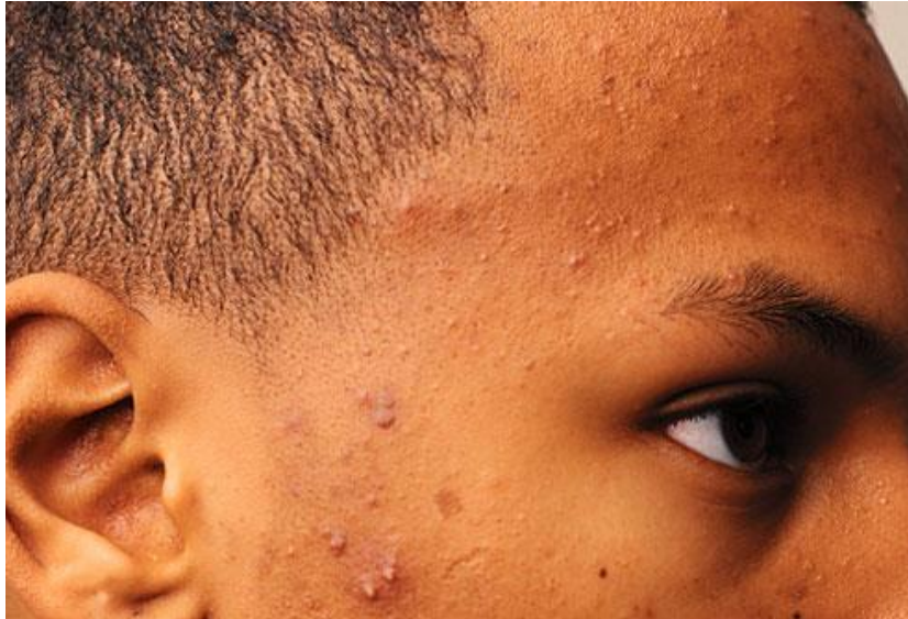
Slika 9. Srednje teški oblik akni (www.webmd.com)