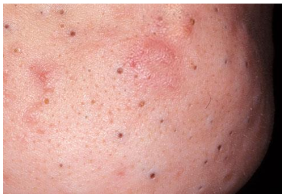
Slika 2. Otvoreni komedoni ( blackheads )

Otvoreni komedon ( blackhead ) ili miteser je veći, otprilike 2-5 mm, ima crni vrh i može se istisnuti, ali je relativno stabilan (Slika 2.).