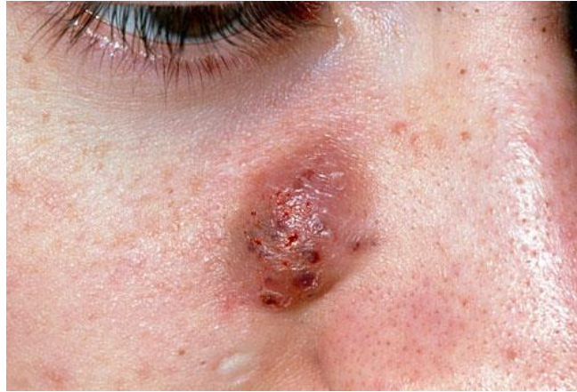
Slika 6. Cista

Pustule i ciste često same od sebe puknu i izlije se gnojni ili krvavi bezmirisni iscjedak. Upalne lezije mogu svrbiti kad eruptiraju i mogu biti bolne. Često takve lezije mogu ostaviti eritematozne ili pigmentirane mrlje koje mogu trajati mjesecima ili čak i duže, posebno kod osoba tamnije puti. Noduli i dublje lezije mogu ostaviti i ožiljke.