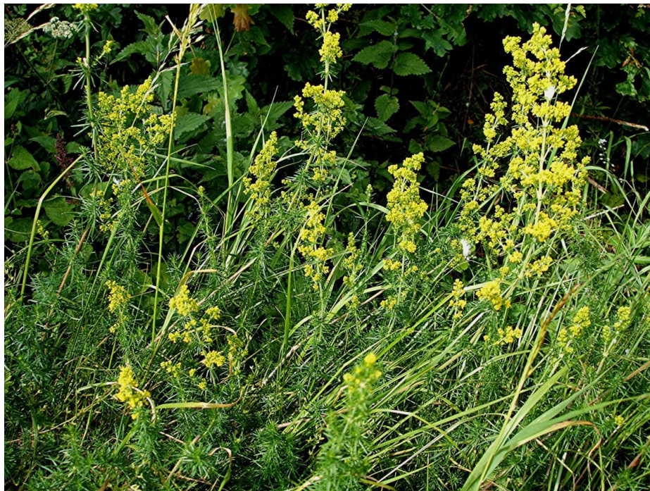
Slika 4.6. Galium verum L.

Galium verum L. (žuta livadna broćika, prava broćika, ivanjsko cvijeće) je višegodišnja zeljasta biljka rasprostranjena na području Europe i Azije. Raste na suhim ocjeditim livadama, uz putove i na šumskim proplancima. Ima puzavu stabljiku dugu do 80 cm. Listovi su sitni (1,5-2 cm dugi, a 1-2 mm široki), a njih 6-12 poredano je u pršljenovima. Cvjetovi su sitni i zlatno-žute boje, a tvore metlaste cvatove na vrhovima grančica. Cvate od srpnja do rujna (Pahlow, 1989; Zovkić, 1999).