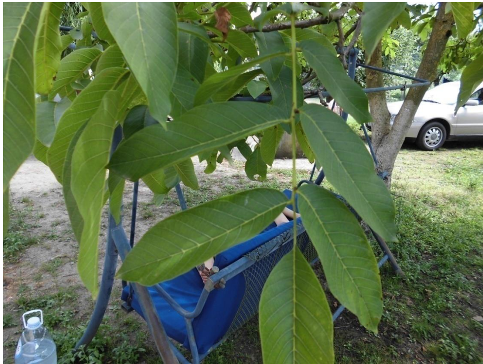
Slika 4.9. Juglans regia L.

Juglans regia L. (obični orah, pitomi orah) je stablo rasprostranjeno na cijelom Balkanskom poluotoku. Raste samoniklo na jugu Balkanskog poluotoka, a kod nas se uzgaja ili raste u šumama kao podivljao (raznose ga vjeverice). Visinom doseže do 20 m. Krošnja je različitog oblika i široka. Listovi su neparno perasti, s 5-9 liski, dugi do 40 cm. Mladi listovi su žljezdasti, dlakavi i ljepljivi, a kasnije su glatki. Pojedine liske su duguljaste, jajaste, malo ušiljene i cjelovitog ruba. Plod je koštunica, isprva zelena, a kada dozrije, sočni ovoj pocrni, puca i ispada nepravilna masna sjemenka obavijena odrvenjelim endokarpom. Orah cvate u travnju i svibnju (Pahlow, 1989).