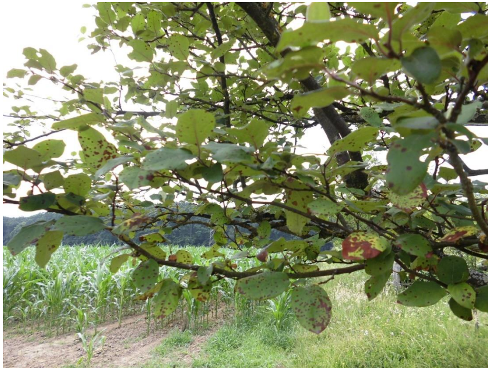
Slika 4.5. Cydonia oblonga Mill.

Cydonia oblonga Mill. (dunja) je grm ili niže drvo rasprostranjeno na području srednje i južne Europe, zapadne Azije te Sjeverne i Južne Amerike. Uspijeva bolje na vlažnim terenima. Visoka je do 8 m i ima nepravilnu krošnju. Listovi su jajoliki ili široko ovalni, cjelovitog ruba, sa sitnim dlačicama. Cvjetovi su pojedinačni, veliki, bijeli ili ružičasti. Mladi listovi su pahuljasto dlakavi, isto tako i plodovi. Plodovi su veliki, žute boje, nepravilna oblika i ugodnog mirisa. Sjemenke su duge oko 10 mm, gotovo trokutaste, crvenosmeđe do smeđeljubičaste boje. Cvate u svibnju (Kuštrak, 2005).