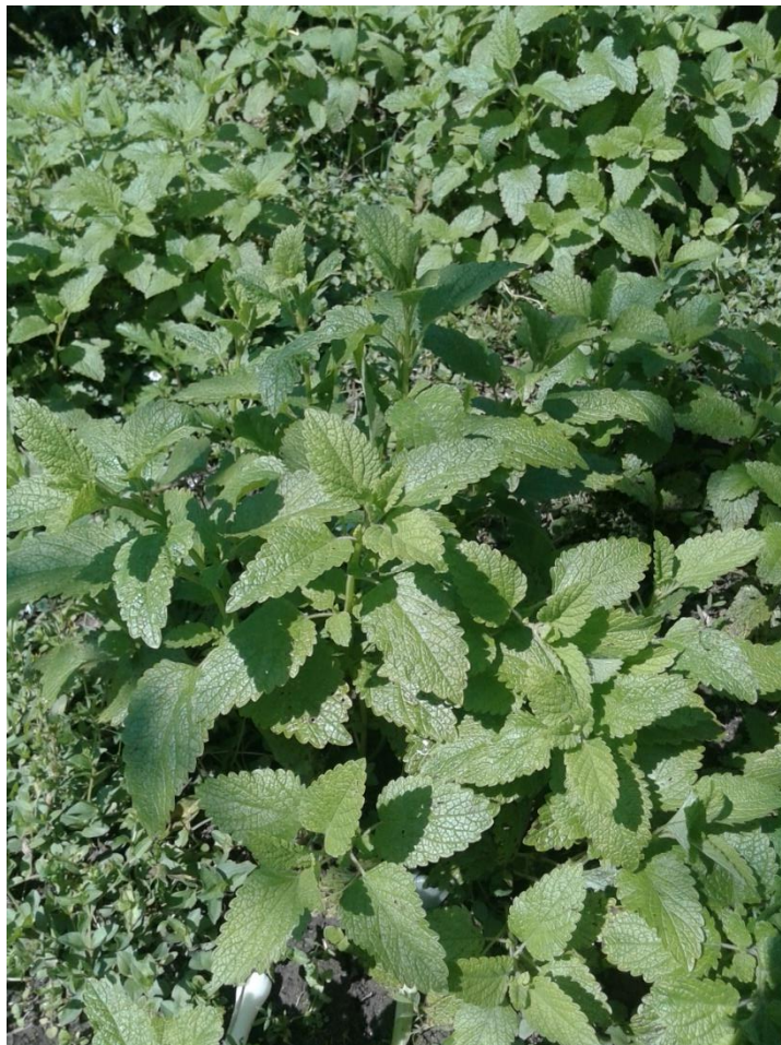
Slika 4.10. Melissa officinalis L.

Melissa officinalis L. (melisa, matičnjak, pčelinja ljubica) je zeljasta trajnica koja potječe s istočnog Sredozemlja gdje raste samoniklo. Danas se uzgaja u Europi, sjevernoj Africi i Americi. Raste na sjenovitim mjestima uz živicu i rubove puteva. Naraste od 30 do 90 cm i često je razgranata, a ima snažan miris limuna. Stabljika je četverobridna, a listovi kratkih peteljki su smješteni nasuprotno. Široko su jajoliki i imaju pilasti rub. Cvjetovi su bijeli ili žućkasti, dvousnati. Po 3-6 cvjetova nalazi se u lisnim pazušcima. Cvate u srpnju i kolovozu (Pahlow, 1989; Schaffner, 1999).