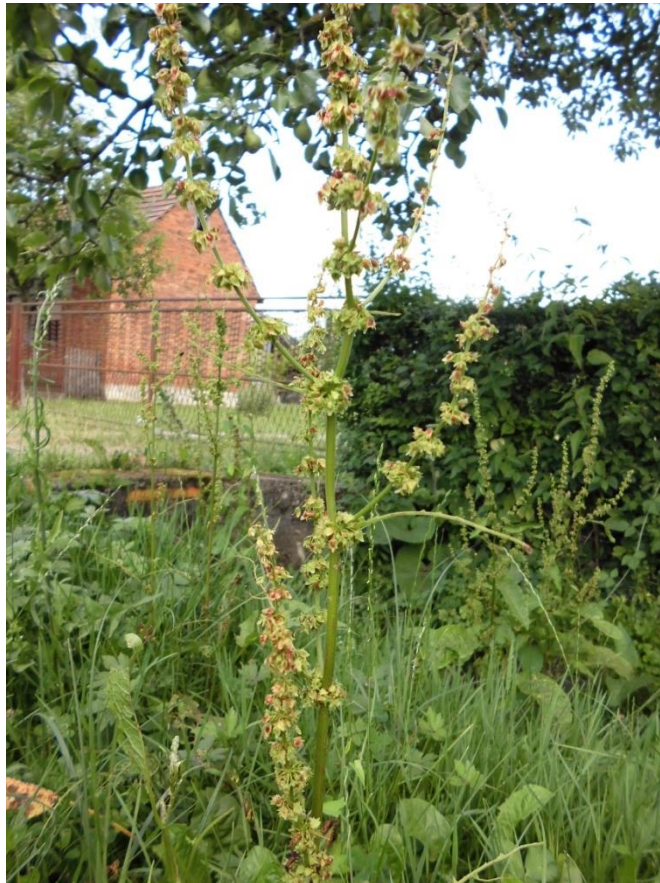
Slika 4.15. Rumex obtusifolius L.

Rumex obtusifolius L. (ščavljak, štavljak, štavelj, konjski štavelj) je zeljasta trajnica rasprostranjena u Europi i Aziji. Raste na vlažnim livadama, u jarcima i strništima u većim količinama, a malo i po vlažnim, sjenovitim šumama i živicama. Biljka je visoka do 1 m. Listovi su srcoliko ovalni, slični hrenovim listovima. Na vrhu stabljike razvijaju se cvjetovi koji su sitni i zelenkastocrveni do sivosmeđi, a kada potpuno dozriju postaju smeđi. Cvjetovi oblikuju klasasti cvat. Korijen je iznutra bjelkastosmeđ, a izvana crvenosmeđ (Gursky, 1999).