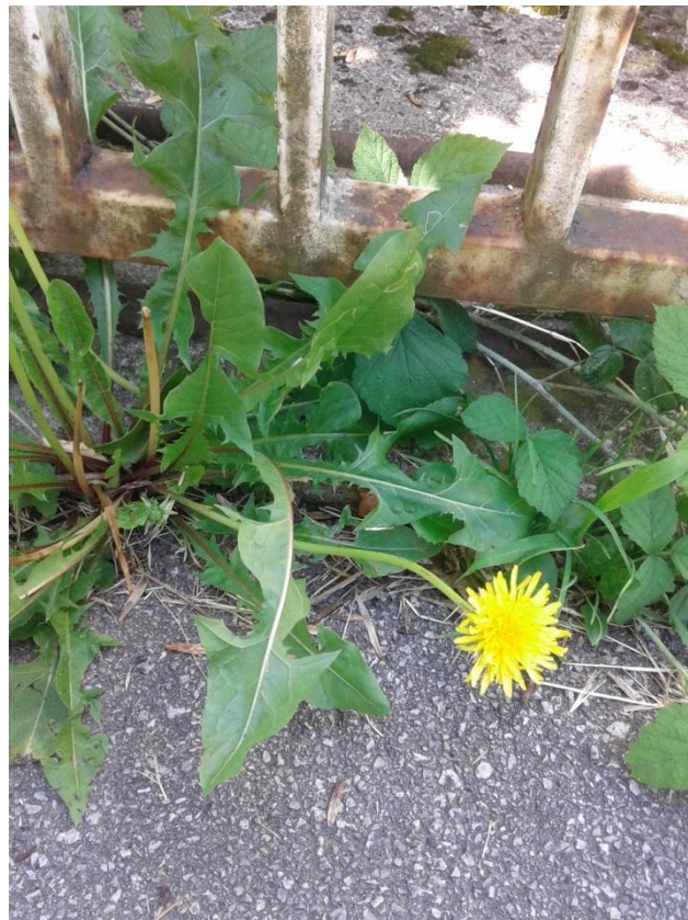
Slika 4.19. Taraxacum officinale Webber

Taraxacum officinale Webber (obični maslačak) je zeljasta trajna biljka autohtona u Europi i dijelu Azije. Danas je rasprostranjen u cijelome svijetu. Raste na područjima od nizinskih do visokoplaninskih, na livadama, travnjacima te u vrtovima. Korijen maslačka je razgranat i valjkast, a dugačak je oko 20 cm. Stabljika je šuplja, visoka do 30 cm i nosi jednu cvjetnu glavicu. Sadrži mliječni sok. Listovi su različitog oblika, najčešće duboko perasto urezani i formiraju prizemnu rozetu. Dugi su 5-25 cm. Rub listova je pilasto nazubljen. Zreli plodovi imaju na vrhu dugi kljun koji na svom vrhu nosi čuperak raširenih dlačica, papus, pomoću kojih se rasprostire vjetrom. Cvate u travnju i svibnju, ponekad ponovno u rujnu i listopadu (Kuštrak, 2005; Pahlow, 1989; Schaffner, 1999).