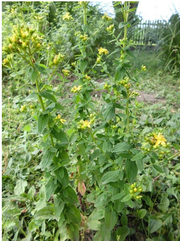
Slika 4.8. Hypericum perforatum L.

Hypericum perforatum L. (obična pljuskavica, kantarion, gospina trava, trava sv. Ivana) je višegodišnja zeljasta biljka rasprostranjena prvenstveno u Europi i Sibiru, a danas je proširena u sva područja suptropske i umjerene klimatske zone. Raste na pašnjacima te na neobrađenim i napuštenim tlima. Ima uspravnu stabljiku visoku 50-70 cm. Grane su paralelne i nose male jajolike listove bez peteljki koji imaju prozirne točkice odnosno žlijezde s eteričnim uljem. Listovi su dugi 1-2 cm i nasuprotno su smješteni na stabljici. Cvjetovi su žuti i formiraju štitaste cvatove. Latice su 3-4 puta duže od čaške i asimetrične. Cvate od lipnja do rujna (Schaffner, 1999; Zovkić, 1999).