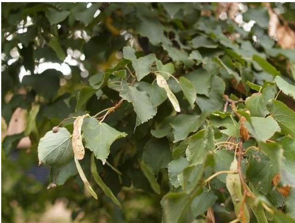
Slika 4.20. Tilia cordata Mill.

Tilia cordata Mill. (kasna lipa, malolisna lipa, lipolist) je veliko i razgranato drvo rasprostranjeno gotovo po cijeloj Europi. Raste samoniklo u listopadnim šumama, ali mnogo se sadi u parkovima i drvodredima kao ukrasna. Oblik listova je srcoliko-okruglast, a rub je pilast. Boja listova se razlikuje s obzirom na stranu lista. Odozgo su listovi tamnozeleni, a odozdo modrozeleni. S donje strane listova između žila nalaze se smeđe dlačice. Cvjetovi su zelenkastožuti, 5-7 cvjetova skupljeno je u paštitaste cvatove s pricvjetnim listom. Miris im je ugodan. Plod lipe je tanak oraščić. Cvate u lipnju i srpnju (Kuštrak, 2005; Pahlow, 1989).