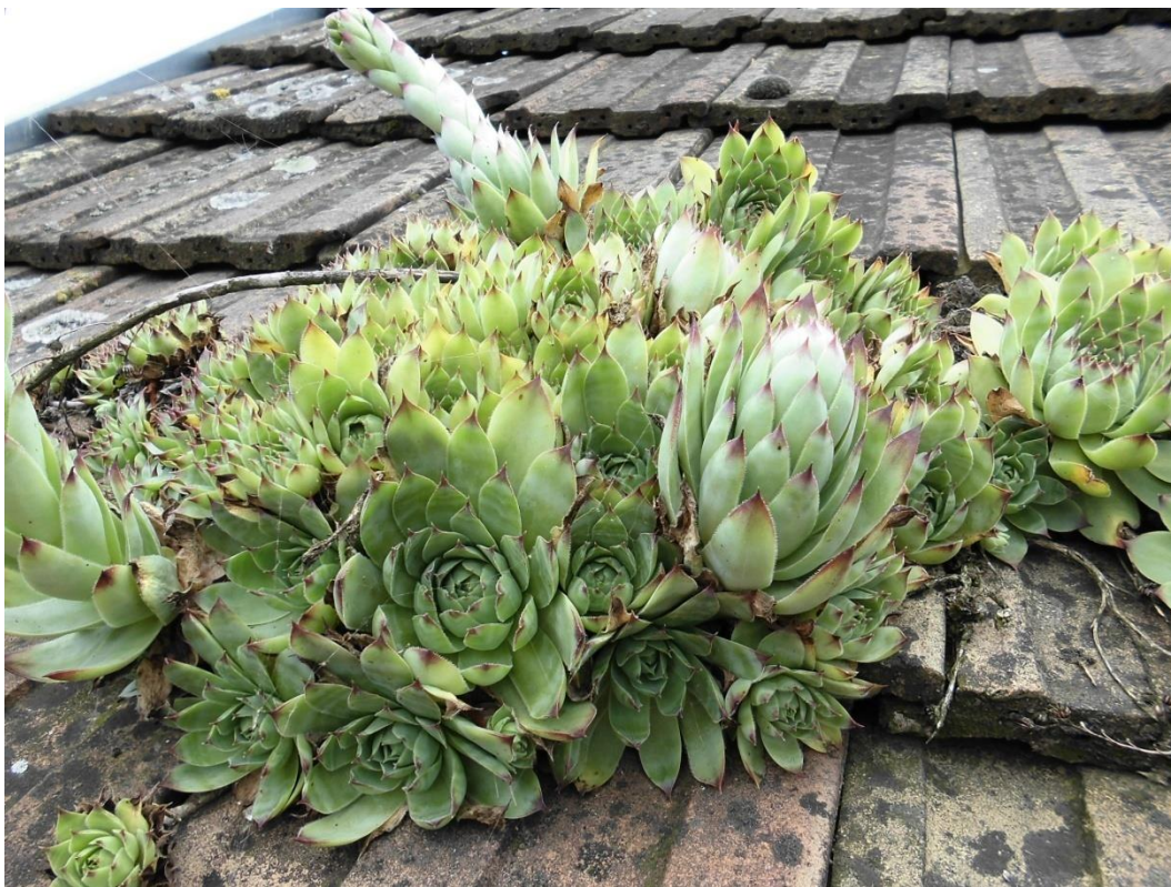
Slika 4.17. Sempervivum tectorum L.

Sempervivum tectorum L. (čuvarkuća, krovna čuvarkuća, netres, ušna, vazdaživa) je zeljasta trajnica rasprostranjena u srednjoj i južnoj Europi i Aziji. Kod nas raste u pukotinama stijena, a često se nalazi na krovovima seoskih kuća. Visoka je do 30 cm. Ima mesnate, zelene i sočne listove koji pri dnu formiraju rozetu iz čije sredine izbija cvjetna stabljika. Cvjetovi su ružičasti i zvjezdasti, a skupljeni su u paštitasti cvat. Cvate od lipnja do rujna (Pahlow, 1989; Zovkić, 1999).