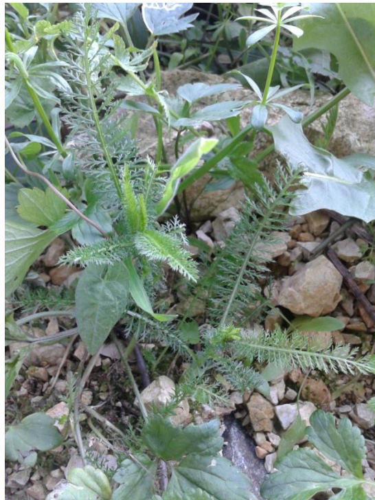
Slika 4.1. Achillea millefolium L.

Achillea millefolium L. (obični stolisnik, hajdučka trava, kunica) je višegodišnja biljna vrsta rasprostranjena u Europi, sjevernoj Aziji i Americi. Raste po livadama, pašnjacima i poljima u području umjerene klime. Ima puzavi podanak iz kojeg izbija prizemna rozeta listova, a zatim cvjetna stabljika. Listovi su dvostruko i trostruko perasti s više od 10 glavnih isperaka, dužine do 20 cm. Stabljika je okrugla, zelenkaste boje, a pri vrhu se grana. Može biti dlakava i visine do 70 cm. Brojne cvatne glavice sastavljene su od najčešće 5 žućkastobijelih, bijelih, ružičastih ili grimiznih jezičastih cvjetova i nekoliko žućkastih cjevastih cvjetova. Stolisnik cvate od lipnja do rujna. Plod je roška duga oko 2 mm (Schaffner i sur., 1999; Kuštrak, 2005; Pahlow, 1989).