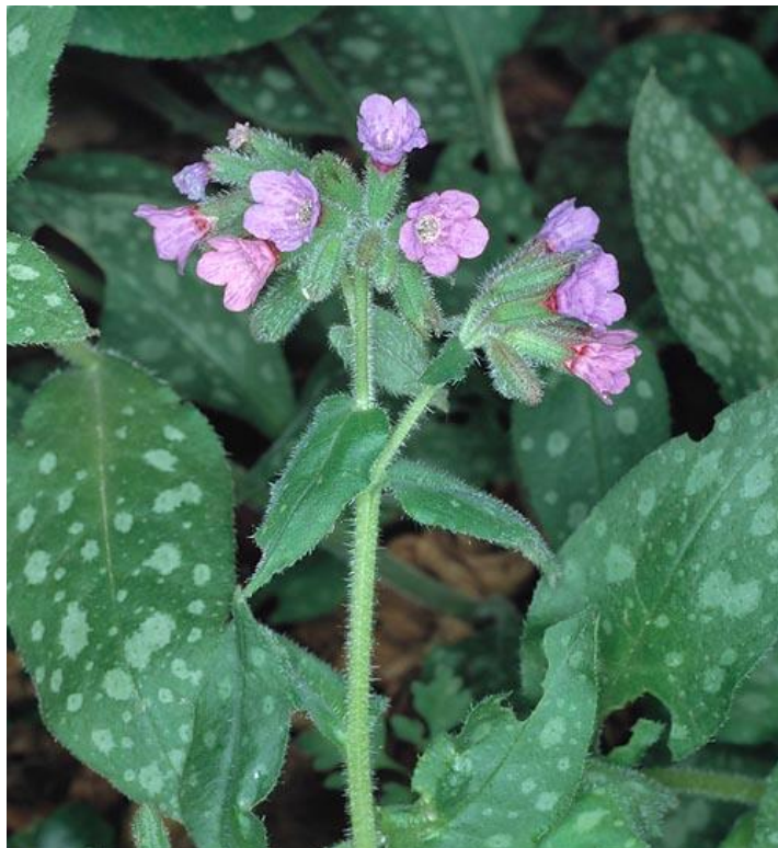
Slika 4.14. Pulmonaria officinalis L.

Pulmonaria officinalis L. (ljekoviti plućnjak, plućnjak) je trajnica rasprostranjena u većem dijelu Europe, a na istok se proteže do Kavkaza. Raste u listopadnim šumama i među grmljem na vapnenastom tlu, u sjeni, najbolje na dubljoj humusnoj zemlji. U zemlji razvija vodoravan podanak. Prizemni listovi razvijaju se uz cvatuću stabljiku, jajoliki su i prema dnu su suženi u peteljku. Listovi na stabljici su manji od prizemnih i sjedeći su. S gornje strane listovi su bodljasto hrapavi i imaju bijele pjege, no ponekad ih nalazimo bez njih. Cvjetovi se razvijaju na vrhu stabljike koja naraste do 30 cm. Oblik čaške je cjevasto-zvonast. Boja latica se kreće od ružičaste u početku do plave na kraju cvatnje. Cvat biljke je paštitac. Cijela biljka prekrivena je ostrim dlakama. Plodovi su crni, sjajni oraščići. Cvate od ožujka do svibnja (Kuštrak, 2005; Pahlow, 1989).