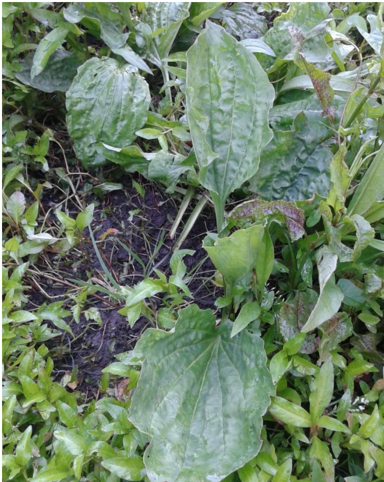
Slika 4.13. Plantago major L.

Plantago major L. (širokolisni trputac, veliki trputac, muška bokvica) je višegodišnja biljka rasprostranjena gotovo u cijeloj Europi, sjevernoj i srednjoj Aziji. Raste na suhim livadama, uz puteve, ali i u planinskim područjima. Stabljika je visine od 10 do 40 cm. Listovi su jajoliki ili eliptični. Plojka lista na sebi ima 3-7 paralelnih žila, cjelovitog je ruba i skoro 2 puta duža nego što je široka. Listovi se naglo sužavaju u peteljku, koja je iste dužine kao i plojka. Listovi stvaraju prizemnu rozetu. Cvat je valjkasti klas. Cvate od lipnja do rujna (Kuštrak, 2005).