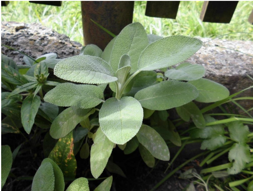
Slika 4.16. Salvia officinalis L.

Salvia officinalis L. (kadulja, ljekovita kadulja, žalfija, salvija) je višegodišnji polugrm rasprostranjen na području srednje i južne Europe. Samoniklo raste na kamenom tlu u našem priobalju. Na kopnu se uzgaja. Visoka je od 50-100 cm. Ima drvenastu stabljiku koja je četverobridna. Listovi su sivo pustenasti, naborani, debeli i imaju dugu peteljku, eliptičnog su oblika i uski, a na stabljici su smješteni nasuprotno. Cvjetovi su ljubičasti, rijetko ružičasti ili bijeli. Imaju dva prašnika. Čaška je izrazito dvousnata. Dlake prekrivaju cijelu biljnu površinu, stoga biljka izgleda sivozeleno pa čak i srebrnkasto. Plod kadulje je kalavac koji se raspada u 4 oraščića. Kadulja cvate od svibnja do srpnja (Kuštrak, 2005; Schaffner, 1999).