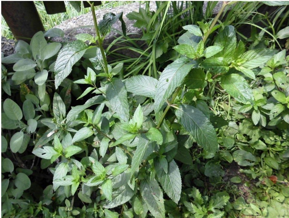
Slika 4.11. Mentha x piperita L.

Mentha x piperita L. (metvica, menta, paprena metvica) je višegodišnja zeljasta biljka koja raste uglavnom u kulturi u mnogim zemljama svijeta. Najbolje raste na vlažnom i ilovastom tlu s vapnencem. Biljka naraste 30-80 cm i ima brojne podzemne i nadzemne vriježe. Gotovo je gola, jako aromatična, četverobridne uspravne i razgranate stabljike. Listovi su nasuprotni, duguljasti, jajasti, dugi 4-7 cm i grubo nazubljena ruba. Cvjetovi su ružičasti i skupljeni u guste klasaste cvatove. Cvate od lipnja do kolovoza (Pahlow, 1989; Schaffner, 1999).