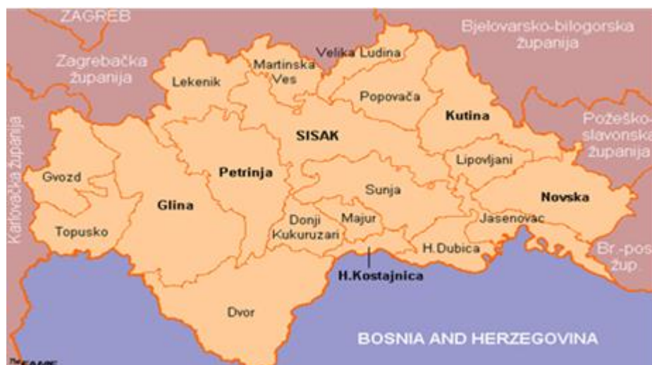
Slika 3.1. Karta Sisačko-moslavačke županije

Terensko istraživanje provedeno je u razdoblju od svibnja do srpnja 2016. godine na području pet sela u okolini grada Novske: Nova Subocka, Stara Subocka, Sigetac, Brestača i Lipovljani. Područje istraživanja smješteno je u zapadnoj Slavoniji, u Sisačko-moslavačkoj županiji. Prirodna je veza obronaka slavonskog gorja i posavske ravnice, s nadmorskom visinom koja se proteže od 90 do 467 m. Na području Novske vlada umjerena kontinentalna klima.