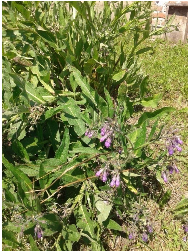
Slika 4.18. Symphytum officinale L.

Symphytum officinale L. (ljekoviti gavez, crni gavez) je višegodišnja zeljasta biljka rasprostranjena u Europi te zapadnoj i centralnoj Aziji. Obično raste uz rijeke, potoke i nasipe te na vlažnim livadama. Visok je 30-150 cm i ima oštre dlake. Ima jak i debeo mesnat korijen iz kojeg izbija šuplja i dlakava stabljika. Korijen je izvana crn, a iznutra bijel. Listovi su krupni, izduženo eliptični i čekinjasto dlakavi. Donji listovi imaju kratke peteljke, a gornji su sjedeći. Cvjetovi su crvenoljubičasti ili žućkastobijeli. Šiljaste ljuške ždrijela ne strše iz cjevastog vjenčića. Cvjetovi oblikuju paštite cvatove na vrhu biljke. Cvate od svibnja do kolovoza (Schaffner, 1999; Zovkić, 1999).