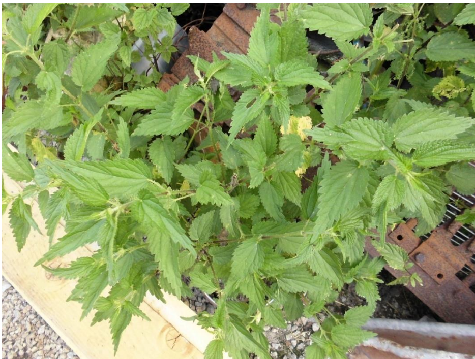
Slika 4.21. Urtica dioica L.

Urtica dioica L. (velika kopriva, kopriva dvodomna, obična kopriva) je zeljasta trajnica rasprostranjena u čitavome svijetu, osim u tropskim i arktičkim područjima. Raste kao korov uz puteve, na zapuštenim mjestima te u blizini naselja. Visoka je 50-150 cm. Ima uspravnu i četverbridnu stabljiku na kojoj se nalaze žljezdane dlačice iz kojih pri dodiru iscuri sok koji žari. Listovi su na stabljici razmješteni nasuprotno, tamnozeleno su boje, jajolikog ili srcolikog oblika, vrh im je šiljast, a rub pilasto nazubljen. Cvjetovi koprive su neugledni i oblikuju cvat koji izgleda kao resa. Kopriva je dvodomna biljka, a to znači da je prašnički cvijet na jednoj, a plodnički na drugoj biljci. Cvate od svibnja do rujna (Kuštrak, 2005; Schaffner, 1999).