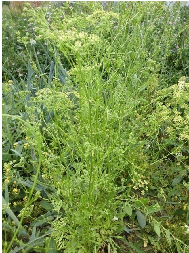
Slika 4.12. Petroselinum crispum Mill.

Petroselinum crispum Mill. (peršin, peršun) je dvogodišnja zeljasta biljka rasprostranjena prvenstveno na području južne Europe, a danas se uzgaja u cijelom svijetu. Ima vretenasto zadebljao korijen iz kojeg svake druge godine izraste do 1 m visoka i razgranjena stabljika s manjim brojem listova, a na vrhu ogranka su štitasti cvatovi. Listovi su u prizemnoj rozeti, trostruko perasti, sjajni i tamnozeleni. Listovi s donjeg dijela stabljike su 2-3 puta rasperjani, a njihove liske su na 3 dijela rascijepljene. Gornji listovi su rascijepljeni na 3 uska dijela. Cvjetovi su maleni i imaju zelenkastožute latice. Cvat je sastavljeni štitac. Plodovi su jajoliki kalavci, sastavljeni od dva poluploda. Cvate u lipnju i srpnju druge godine (Kuštrak, 2005; Pahlow, 1989).