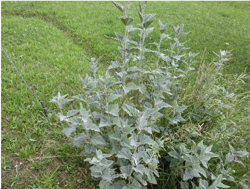
Slika 4.3. Althaea officinalis L.

Althaea officinalis L. (bijeli sljez, pitomi sljez, obični bijeli sljez, sljezovina) je zeljasta trajnica rasprostranjena na području Azije i južne Europe. Najbolje raste u nižim vlažnim livadama i pašnjacima, uz grmove i šikare na dubokim tlima. Biljka je visoka 50-150 cm, dobro razvijena. Oblasla je mekim, sivkastim dlakama. Listovi su trokutasto ovalni, prema vrhu šiljasti, nazubljena ruba i podijeljeni na 3-5 režnjeva. Na stabljici su izmjenično poredani. Cvjetovi promjera do 5 cm, bijele ili blijede ružičaste boje s tamnocrvenim prašnicima, imaju kratke stapke. Vanjska čaška sastavljena je od 6-9 dijelova. Cvate od srpnja do rujna (Kuštrak, 2005; Pahlow, 1989; Schaffner, 1999).