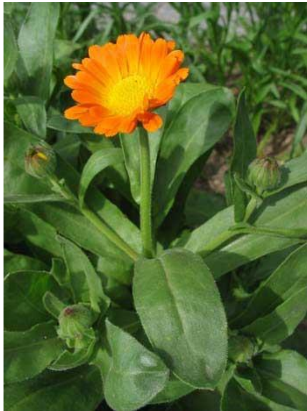
Slika 4.4. Calendula officinalis L.

Calendula officinalis L. (ljekoviti neven) je jednogodišnja ili dvogodišnja biljka rasprostranjena na području Sredozemlja. Danas se uzgaja kao vrtna biljka. Biljka je visoka 20-50 cm, od sredine razgranata. Stabljika je uspravna, dlakava s naizmjenično postavljenim listovima, koji su također dlakavi. Donji listovi su lopatasti, postupno se sužavaju u krilastu peteljku. Gornji listovi su suličasti. Cvjetne glavice imaju promjer 2-5 cm, a okupljene su u glavičasti cvat. Njihova boja je narančasto-žuta. Plodovi su uvijeni unutra, različitih oblika. Cvate od srpnja do rujna (Pahlow, 1989; Schaffner, 1999).