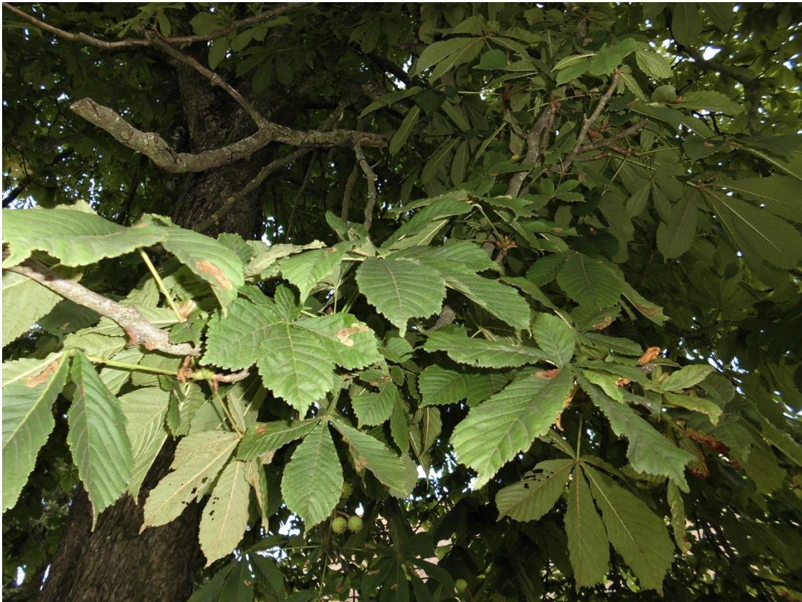
Slika 4.2. Aesculus hippocastanum L.

Aesculus hippocastanum L. (divlji kesten) je drvo guste krošnje visoko do 30 m rasprostranjeno prvenstveno u južnoj Europi i zapadnoj Aziji. Raste na humusnom, ali i pjeskovitom tlu s ilovačom. Listovi su dlanasti, sastavljeni od 5-7 dijelova, a liske su najšire u sredini. Cvjetovi su bijeli sa žutim ili crvenim mrljama, imaju najčešće 7 prašnika. Plod je tobolac, okruglast i bodljikav, a sadrži jednu do četiri sjemenke. Divlji kesten cvate od travnja do svibnja (Kuštrak, 2005; Schaffner, 1999)