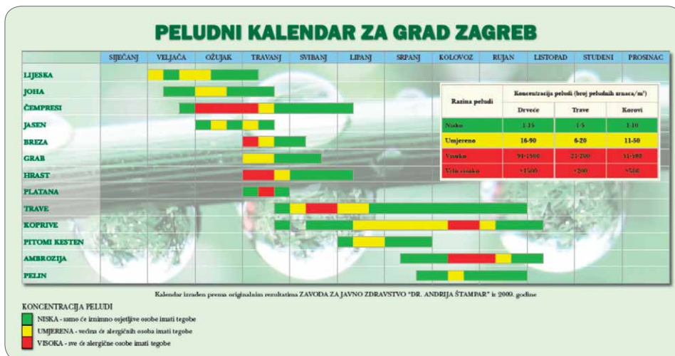
Slika 1. Peludni kalendar za grad Zagreb

Naravno, koncentracije peluda u zraku ovise o geografskom području, klimi, vegetaciji određenog područja te drugim mikroklimatskim uvjetima. U Hrvatskoj se razlikuju dva vegetacijska pojasa koncentracije, kontinentalni i primorski pojas (tablica 1.) (4).