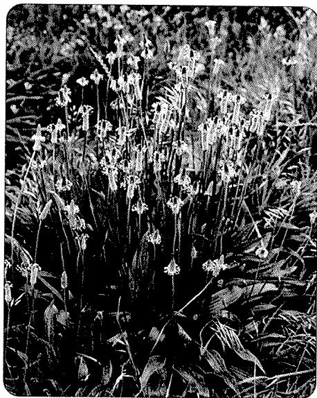
Slika 1. Plantago lanceolata L. – suličasti (uskolisni) trputac

Suličasti (uskolisni) trputac – Plantago lanceolata L. (slika 1.) i veliki (širokolisni) trputac – Plantago major L. (slika 2.) niske su zeljaste trajnice iz porodice Plantaginaceae . Listovi tih vrsta složeni su u prizemnu rozetu i imaju 3–7 uzdužnih provodnih žila, istaknutih na naličju. Cvatovi klasovi javljaju se na vrhu zeljastih bezlisnih stabljika (batva) (1). Ove biljke cvjetaju od svibnja do rujna, a rasprostranjene su gotovo u čitavom svijetu, od nizinskih do planinskih pašnjaka, uz nasipe, međe i putove.