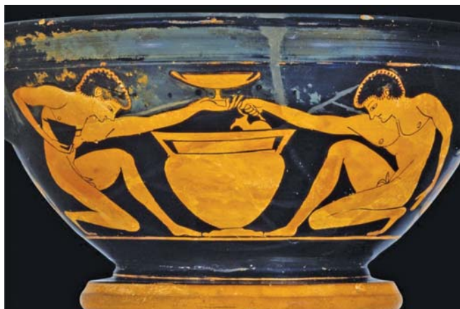
Slika 1. Posuda za miješanje vina i vode, tzv. krater (3)

Tijekom godina vino se iz domovine Kavkaza polako počelo širiti na jug, preko Levanta (današnja Sirija, Jordan, Libanon i Izrael) prema Egiptu, te na zapad, prema Anatoliji i Grčkoj. Dok je vino u Egiptu bilo rezervirano za faraone i ostalu elitu, u antičkoj je Grčkoj vino postalo omiljeno piće svih društvenih slojeva. Kakvu je važnu ulogu vino tada imalo najbolje pokazuju riječi grčkog pisca i povjesničara Tukidida iz 5. stoljeća pr. Kr. prema kojima su »narodi Sredozemlja prestali biti barbari kad su naučili uzgajati vinovu lozu i maslinu«. Stari su Grci vino redovito ispijali na tzv. simpozijima, gozbama koja su bila mjesta za neobavezno, ali i natjecateljsko druženje u kojemu bi sudionici pokušavali pobijediti u raspravama, pjesništvu i govorništvu. Intelektualnoj atmosferi simpozija savršeno je pristajala profinjenost vina, a i danas se često poslužuje na stručnim skupovima, koji se po uzoru na Grke nazivaju simpoziji. Zanimljivo je da se grčki pristup vinu razlikuje od današnjeg po običaju miješanja vina s vodom koje se provodilo u posebnim posudama, tzv. kraterima (slika 1.) (3). Naime, vjerovalo se da samo Dioniz, bog vina i veselja, može piti čisto vino, dok se ta navika među smrtnicima smatrala barbarskom. Na taj su način Grci produživali uživanje i odgađali nastup pijanstva, a sve s ciljem održavanja vlastite slike visoke civiliziranosti (1, 2).