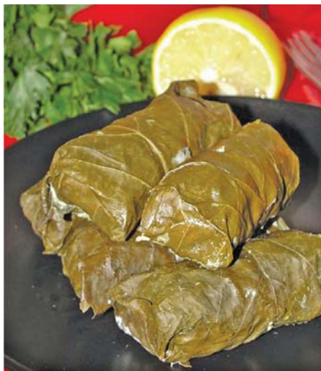
Slika 3. Listovi vinove loze u kulinarstvu (11)

Plodovi su vrlo ukusni i osvježavajući u svježem stanju, ali često se i suše za dobivanje grožđica, odnosno cveba. Bogati su flavonoidima i to prvenstveno antocijanima, osobito plodovi crnog grožđa, te vinskom i drugim fenolnim kiselinama, ali i posebnom vrstom fenola, tzv. resveratrolom. Ta tvar spada u skupinu fitoestrogena, a u najvećoj količini se nalazi na površini egzokarpa plodova te štiti grožđe od plijesni (5–10, 12, 13).