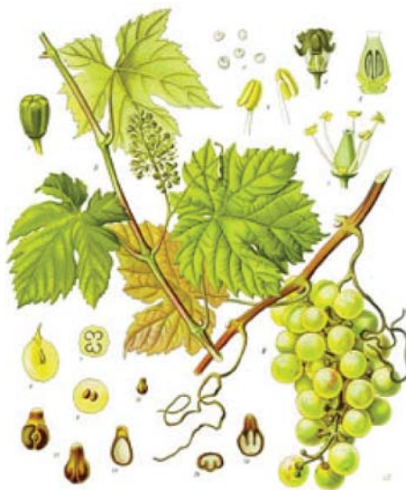
Slika 2. Ilustracija vrste Vitis vinifera L., Vitaceae (4)

Ime vino potječe od latinske riječi viere koja znači vijugati, izvijati se – opisujući pritom uvijenu biljku vinove loze od koje se dobiva. Vinova loza ( Vitis vinifera L.) (slika 2.) (4), trajna je dvodomna listopadna penjačica iz porodice Vitaceae koja je u narodu poznata i pod nazivima loza, trs, čokot ili vinjaga. Naraste i do 20 metara, a crvenosmeđe ili tamnožute grane penju se po drveću i grmlju pomoću posebnih preobrazbi stabljike, tzv. vitica, koje se nalaze nasuprot listovima. Listovi su dlanasto razdijeljeni na 3–5 nejednako nazubljenih režnjeva, na naličju dlakavih te smještenih na dugačkim peteljčkama. Dvospolni cvjetovi su mali i neugledni, zelenkaste boje i skupljeni u metličaste cvatove koji se razvijaju u lipnju. Plodovi su okruglaste bobice koje dozrijevaju u kolo-vozu i rujnu, slatkokiselkastog okusa i boje ovisne o sorti, a svaka bobica sadrži 2–3 sitne sjemenke. Iako su prvotno stanište samonikle loze bile vlažne šume i obale rijeka i potoka, danas se uzgaja posvuda u čitavom svijetu. Tijekom stoljetnog uzgoja nastao je velik broj sorti, približno 10 000, a u Hrvatskoj ih je 130 autohtono (5–10).