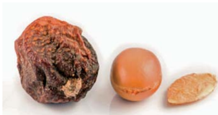
Slika 3. Osušeni plod, orah i sjemenka argana

Zreli plodovi sadrže smeđu ovojnicu (slika 3.) koja se mora ukloniti da bi došli do pulpe i oraha unutar kojeg se nalaze sjemenke s uljem.