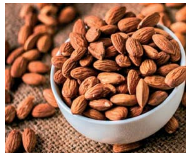
Slika 2. ► Sjemenke badema – Prunus amygdalus ((Mill.) D.A.Webb) (5)

U prehrani se rabe suhe, jestive sjemenke badema, listopadnog stabla iz porodice ruža ( Rosaceae ). Po opisu badem je do 10 metara visoko drvo i tvori široku, piramidalnu krošnju. Korijenov sustav je jak i dubok. Deblje je do 30 cm u promjeru, kora je u mladosti glatka i sivozelena, kasnije postane svijetlosiva i ljuškava. Grane su gole i bez trnova. Listovi su smješteni naizmjenično, a nalaze se na peteljci dugoj 2–3 cm; plojke su dužine 10–12 cm, ušiljenih vrhova i nazubljenih rubova. Cvjetovi su pojedinačni, dvospolni pravilni, promjera do 2 cm. Građeni su od čaške koju čine pet zelenih lapova i vjenčića od pet latica bijele ili nježno ružičaste boje. Prašnici su mnogobrojni. Badem cvjeta prije listanja već i zimi, u siječnju i veljači. Plod je sivozelena dlakava koštunica, obavijena je usplodem koje se otvori kada u jesen dozrije te otkriva tvrdu, ali glatku smeđu ljusku koja je prekrivena s puno malih rupica. Unutar nje nalazi se gola 1,5–3 cm duga, spljoštena sjemenka smeđe ovojnice (slika 2.). Badem raste na području Srednjeg