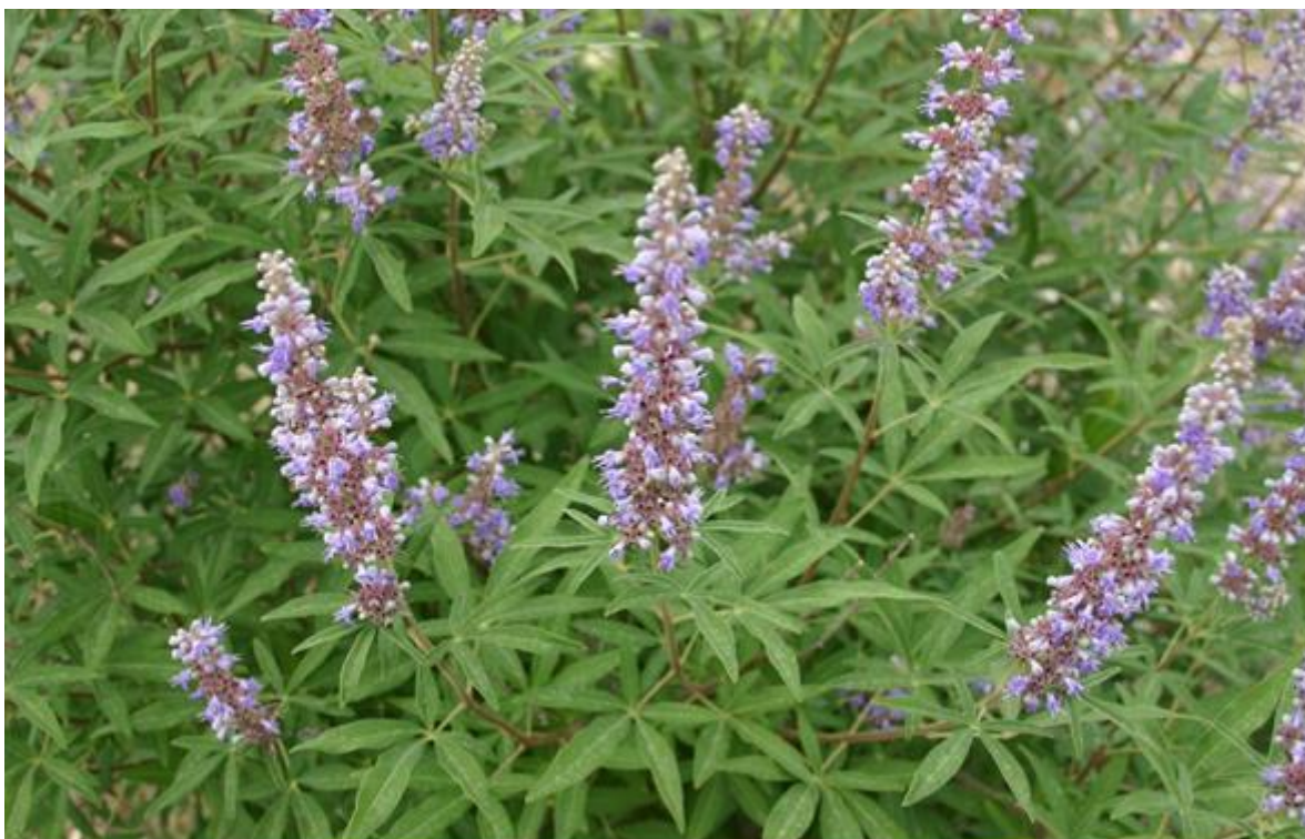
Slika 1. Konopljika ( Vitex agnus-castus L.)