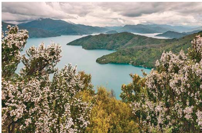
Slika 1. ◀ Vrsta Leptospermum scoparium J. R. Forst. & G. Forst. u cvatu na Novom Zelandu (4)

na Novi Zeland. Danas je najraširenija drvenasta vrsta Novog Zelanda, osobita po tome što veoma dobro podnosi široki raspon okolišnih uvjeta te stoga čini vrlo važnu sastavnicu ekosustava (2). Pojavljuje se na različitim staništima sve od morske razine pa do iznad 1600 m n.v. (slika 1.).