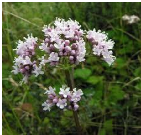
Slika 11. Valeriana officinalis (L.)

SASTAV I AKTIVNE TVARI: Odoljenov korijen sadrži 0,3-2,0 % eteričnog ulja čiji kemijski sastav varira. Eterično ulje sadrži monoterpene: pinene, (-)-kamfen, (-)-limonen, p-cimen, te estere mravlje, maslačne, octene i izovalerijanske kiseline s borneolom, eugenolom i izoeugenolom. U ulju ima i seskviterpena: kariofilena, \beta -bisabolena, alkohola valerola i ketona valeranona (Kuštrak, 2005).