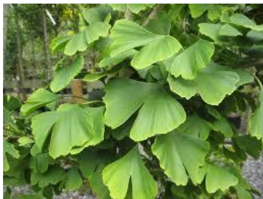
Slika 9. Ginkgo biloba (L.)

Terapijski važna skupina su diterpentrilaktoni: ginkolidi A, B, C i J (Kuštrak, 2005).