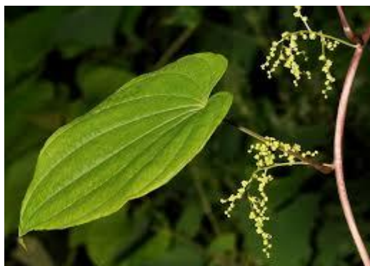
Slika 6. Dioscorea villosa (L.)

SASTAV I AKTIVNE TVARI: Biljka sadržava steroidne saponine – diosgenin, alkaloide, trijeslovine, fitosterole i škrob (Borelli, 2010).