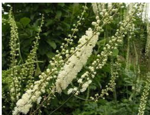
Slika 3. Cimicifuga racemosa (L.)

SASTAV I AKTIVNE TVARI: Droga sadrži triterpenske glikozide, flavonoide, fenolne kiseline, hlapljiva ulja i trijeslovine (Borrelli, 2010).