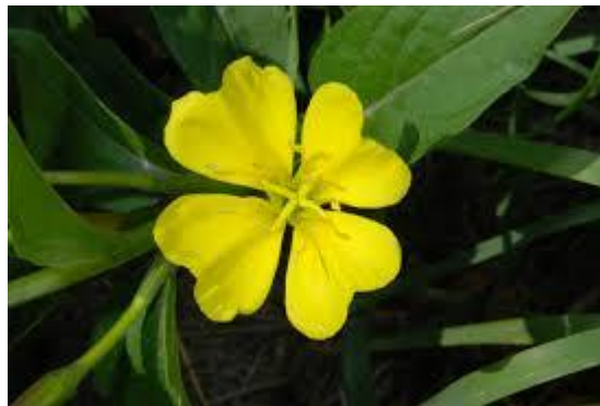
Slika 7. Oenothera biennis (L.)

SASTAV I AKTIVNE TVARI: Sjemenke sadrže 24% ulja koje je sastavljeno od linolne, \gamma -linoleinske, oleinske, palmitinske i stearinske kiseline. U sjemenkama se nalaze i bjelančevine s aminokiselinama koje sadrže sumpor- cistein, metionin i triptofan (Toplak Galle, 2001).