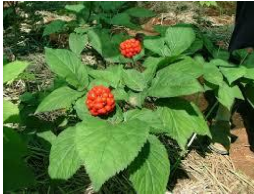
Slika 10. Panax ginseng (L.)

SASTAV I AKTIVNE TVARI: Korijen sadržava triterpenske saponine (ginsenozide), aminokiseline, vitamine (posebno niacin i folnu kiselinu), alkaloide, fenolne spojeve i flavonoide (Borrelli, 2010).