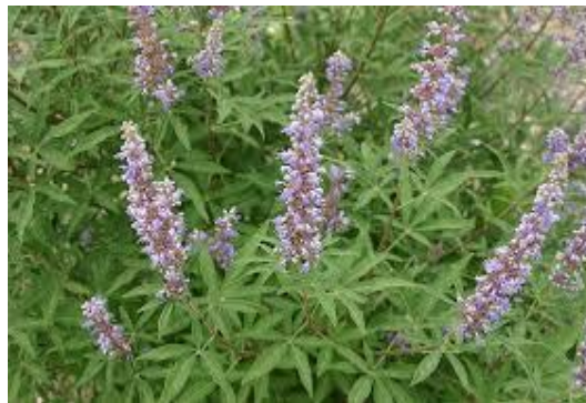
Slika 5. Vitex agnus castus (L.)

SASTAV I AKTIVNE TVARI: biljka sadrži flavonoide, alkaloide, diterpene, viteksin, te kasticin (Kuštrak, 2005).