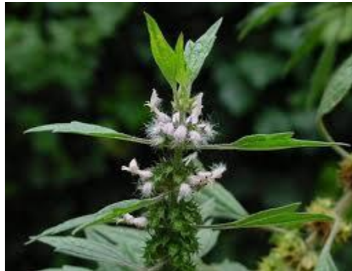
Slika 12. Leonorus cardiaca (L.)

SASTAV I AKTIVNE TVARI: Zelen obične srčenice sadrži eterično ulje, trijeslovine, gorke tvari, glikozide koji utječu na srce i alkaloide (Toplak Galle, 2001).