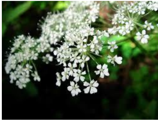
Slika 4. Angelica sinensis (L.)

SASTAV I AKTIVNE TVARI: biljka sadrži kumarine (angelol, angelicin i bergapten), fitosterole, polisaharide, flavonoide, minerale i vitamine (Borrelli, 2010).