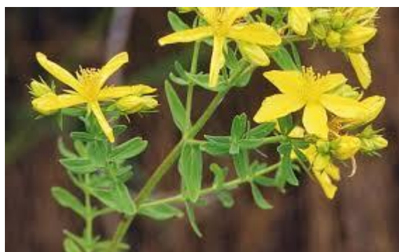
Slika 8. Hypericum perforatum (L.)

SASTAV I AKTIVNE TVARI: Zelen gospine trave sadržava flavonoide (rutin, hiperozid i kvercetin), klorogensku kiselinu, naftodiandrone (hipericin i pseudohipericin), te fluoroglucinske derivate (hiperforin i adhiperforin) (Kuštrak, 2005).