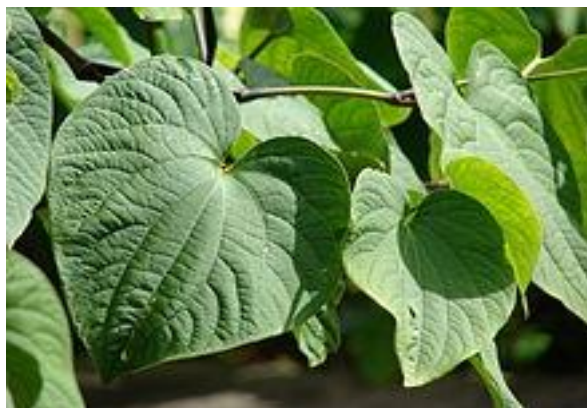
Slika 14. Piper methysticum (L.)

SASTAV I AKTIVNE TVARI: Osušeni korijen sadrži kavalaktone, zatim bornil ester cimetine kiseline i 5,7-dimetoksi-flavanon (Xuan, 2010).