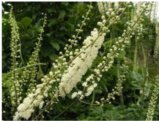
Slika 3. Cimicifuga racemosa (L.)

SASTAV I AKTIVNE TVARI: Droga sadrži triterpenske glikozide, flavonoide, fenolne kiseline, hlapljiva ulja i trijeslovine (Borrelli, 2010).