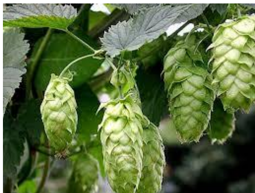
Slika 13. Humulus lupulus (L.)

SASTAV I AKTIVNE TVARI: ženski cvatovi sadrže eterično ulje, mono i seskviterpene. Najznačajniji sastojci su mircen, humulen, kariofilen i 2-undekanon. Gorke tvari hmelja su humulon i lupulon. Sadrži i kalkone, flavanone, flavonole, katehine, proantocijanidine, kondenzirane trijeslovine i metilbutenol (Toplak Galle, 2001).