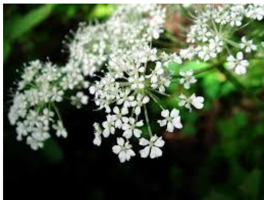
Slika 4. Angelica sinensis (L.)

SASTAV I AKTIVNE TVARI: biljka sadrži kumarine (angelol, angelicin i bergapten), fitosterole, polisaharide, flavonoide, minerale i vitamine (Borrelli, 2010).