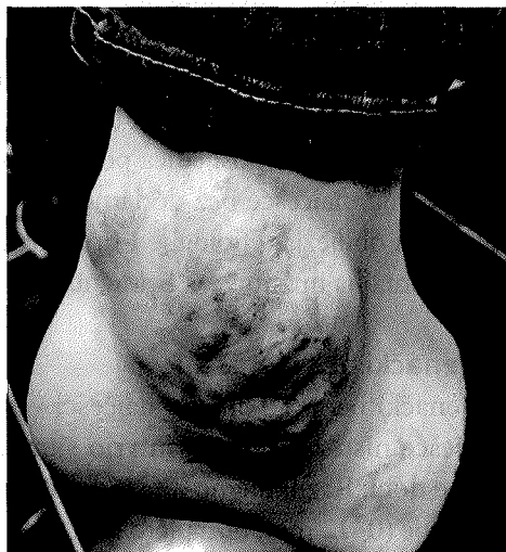
Slika 2. ► Vaskularna malformacija gležnja (fotografirano uz dopuštenje roditelja)