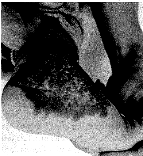
Slika 1. ► Dojenački hemangiom gležnja (fotografirano uz dopuštenje roditelja)

karakter. Dijagnoza se postavlja na temelju kliničke slike. U 10–20 % slučajeva proliferacija endotela je tako jaka, da se javlja nekontroliran rast koji zahtijeva terapijski postupak. Kad je terapijski postupak nužan, procjena se čini individualno na temelju dobi pacijenta, faze rasta hemangioma, lokalizacije hemangioma, veličine, zahvaćanja vitalnih struktura i komplikacija. Prema smjericama za liječenje hemangioma u dojenčadi glavni ciljevi su zaustavljanje nekontroliranog rasta i zahvaćanje vitalnih struktura, sprječavanje i liječenje ulceracija, smanjenje ožiljaka i boli, kako bi se spriječilo trajno estetsko nagrdživanje, smanjenje psihosocijalnog stresa i za pacijenta i obitelj. Peroralno liječenje propranololom je prvi izbor u terapiji kompliciranih dojenačkih hemangioma (3).