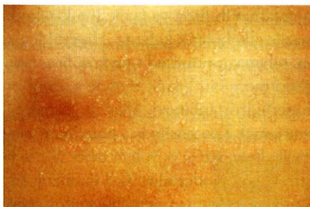
Slika 5. Miliaria crystallina (4).