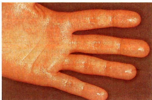
Slika 3. Palmarna hiperhidroza (4).

što je hipertireoza. Također nastaje uslijed uzimanja nekih lijekova (salicilna kiselina, meproamat, kortikosteroidi), nikotina, konzumacije alkohola ili kofeina. Hiperhidroza najjače je izražena na koži pazušne jame, dlanova, tabana, a ponekad i na koži lica, šije, presternalne regije i leđa. Pojava pojačanog znojenja može biti lokalizirana te s obzirom na zahvaćenu površinu govorimo o: palmarnoj hiperhidrozi (dlanovi; Slika 3), facijalnoj hiperhidrozi (lice), aksilarnoj hiperhidrozi (pazušne jame). Kao posljedica pojačanog znojenja na intertriginoznim mjestima dolazi do iritacije kože, što je povoljan uvjet za razvitak sekundarnih dermatozia kao što su mikoze, intertrigo i piodermije. Kod ljudi koji ruke često peru sapunima i u kontaktu su sa raznim kemikalijama potencira se pojačano znojenje dlanova. Pojačano znojenje nogu praćeno je često i neugodnim mirisom koji nastaje kao posljedica raspadanja stratum corneuma uslijed bakterijske razgradnje (4,7).