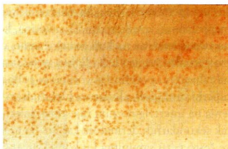
Slika 6. Miliaria rubra (4).

Dishidroza je iznenadna pojava sitnih bistrih mjehurića na području dlanova, tabana i postraničnih dijelova prstiju i nogu, a često je popraćena umjercnim svrbežom. Pretpostavlja se da je uzrok začepljenje izvodnih kanala znojnica (moguće uslijed kontaktnog dermatitisa ili dermatomikoze) zbog čega dolazi do prekomjernog orožnjavanja. Orožnjavanje zahvaća izvodne kanale, a kao posljedica nastaje retencija znoja i pojava mjehurića (4).