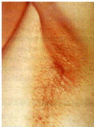
Slika 2. Morbus Fox-Fordyce (4).

Morbus Fox-Fordyce (Slika 2) je kronična papulozna dermatozna koja se najčešće javlja (više od 90%) kod mlađih žena. Pretpostavlja se da hormonski utjecaji izazivaju oštećenja folikularnog epitela, a time i poremećaje prolaska sekreta apokrnih žlijezda koje se otvaraju u folikule dlaka. U žena poslije puberteta obično se pojavljuju konične folikularne papule boje kože uz jaki svrbež na području pazušnih jama, oko areola dojki te anogenitalno. Bolest perzistira do menopauze kada najčešće dolazi do spontanog poboljšanja (4, 7).