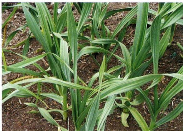
Slika 3. Divlji poriluk ( Allium ampeloprasum L.)

Ovaj lijepi sredozemni luk u Hrvatskoj raste kao samonikao i to u južnim i primorskim krajevima uz oranice, putove i po vinogradima. Naraste od 40 do 200 cm s bjelkastom, ovalnom ili kuglastom lukovicom. Stabljika je debela, okrugla i samo u donjem di-