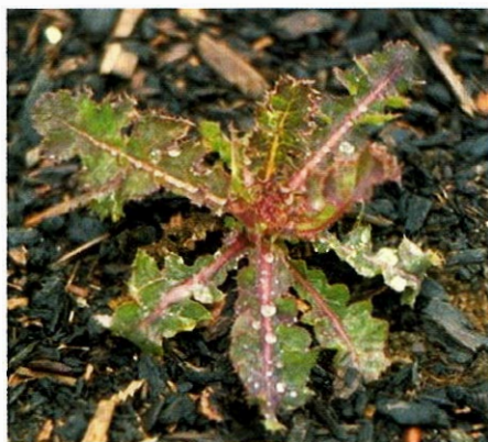
Slika 5. Oštri kostriš ( Sonchus asper L. Hill.)

Vrsti Sonchus asper vrlo je slična vrsta Sonchus oleraceus L. Međutim glavni znak za smanjenu srodnost je nemogućnost križanja ovih dviju vrsta. Oštri kostriš je i termofilniji i više vezan za kulture okopavina. Njegovi su listovi čvršći, bodljikavo nazubljeni i uz stabljiku prirasli srcastom bazom, a roške su glatke (1). Koliko god bodlje na listovima izgledale oštre, listovi su mekani i jestivi čak i sirovi, a prodaju se na tržnicama kao sastavni dio mješavine divlje zeleni (mišanca).