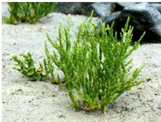
Slika 1. Omaga ( Salicornia europaea L.)

Omaga spada u najčudnovatnije pojave srednjoeuropskog biljnog svijeta i svojim ograncima razgranatim poput svjećnjaka podsjeća više na algu nego na cvjetnjaču. Čini pionirsku vrstu kojom kopnena vegetacija osvaja muljevite morske obale, a nakon nje se na tu obalu naseljavaju više biljke koje ju zatim istisnu. Obvezni je halofit, a među svim lobodnjačama podnosi najveći postotak soli. Za najuspješniji razvoj ova biljka treba 2,5–3% soli u podlozi, a podnosi i koncentracije do 12%. U nedostatku soli jedva uspijeva (4). Objašnjenje da je težište areala omage rudno područje centralne Azije leži u činjenici da se soli s površine tla ne ispiru rijetkim kišama, nego se kapilarno uspinju i koncentriraju na površini tijekom dugog sušnog razdoblja. Omaga sadrži dosta raznih soli: oko 4% natrij-klorida, soli magnezija 0,25% (uvjetuju gorak okus), oko 0,5% kalija, male