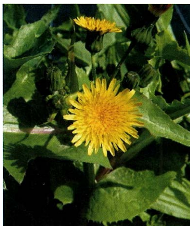
Slika 4. Kostriš ( Sonchus oleraceus L.)

Kostriš je jednogodišnja biljka s uspravnom i razgranjenom stabljikom, visokom do 1 m. Listovi su veliki, mekani, plavozeleni i nepravilno su nazubljeni. Donji su na peteljka, a gornji prirasli uz stabljiku. Žute cvjetne glavice složene su na vrhu stabljike i ogranaka u rahli štitasti cvat. Plodovi su zrnato naborane roške s kunadrom. U svim dijelovima stabljike ima dosta mliječnog soka. Listovi sadrže oko 50 mg% vitamina C i oko 10 mg% karotena (1).