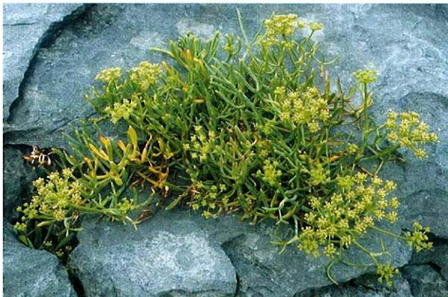
Slika 2. Matar ( Crithmum maritimum L.)

U svježe ubranim listovima ima oko 20 mg% vitamina C te oko 2% karotena. Poseban miris biljci daje eterično ulje kojega u plodovima ima oko 0,7%. Glavni je sastojak eteričnog ulja dilapiol, koji autori smatraju otrovnim. Biljka, međutim kao povrće nije toksična, ali ima slabo izražen diuretičko djelovanje (1).