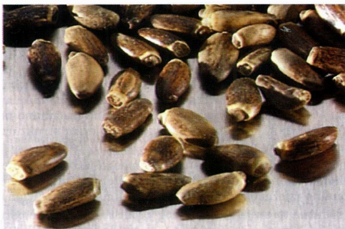
Slika 2. Cardui mariae fructus – plodovi sikavice

Drogu predstavljaju zreli i od papusa očišćeni plodovi sikavice, Cardui mariae ili mariani ( Silybi mariae ) fructus , koji su žutosmeđi ili tamnosmeđi, do crno obojeni, oko 7 mm dugi i oko 3 mm široki. U promet dolaze često pod neispravnim nazivom kao Semen cardui mariae (1). Droga je oficinalna u njemačkoj farmakopeji pod naslovom Cardui mariae fructus , a u homeopatskim farmakopejama HAB 34 i HPUS 64 pod naslovom Carduus marianus . Dok njemačka homeopatska farmakopeja izrađuje tinkturu iz zrelih plodova (sjemenca), američka homeopatska farmakopeja upotrebljava cvatuću biljku ili plodove (sjemenke) (1). U pučkoj medicini upotrebjavaju se listovi, Cardui mariae folium (6), a Hagers Handbuch citira i zelen, Cardui mariae herba .