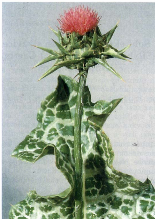
Slike 1. Cvjetna glavica s trnovitim ovojnim ljuskama