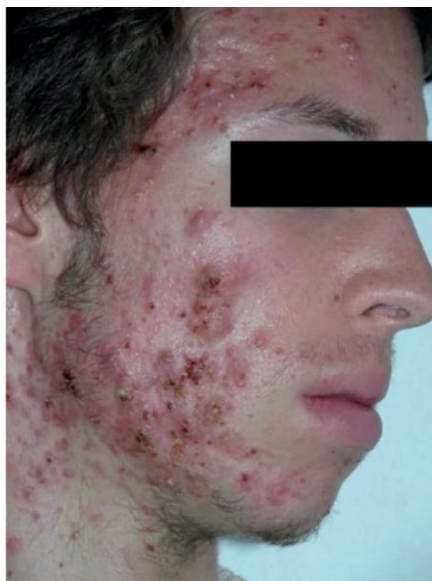
Slika 5. Acne conglobata (Basta Juzbašić, 2010)