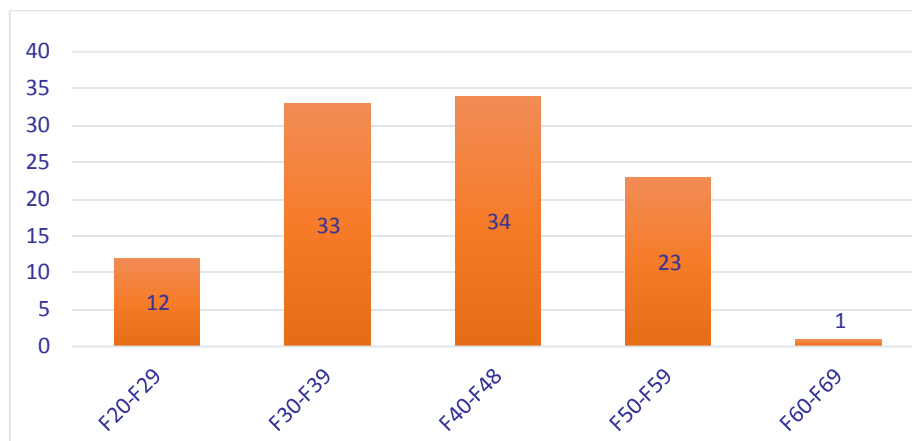
Slika 1. Prikaz komorbiditeta iz područja mentalnih poremećaja i poremećaja ponašanja