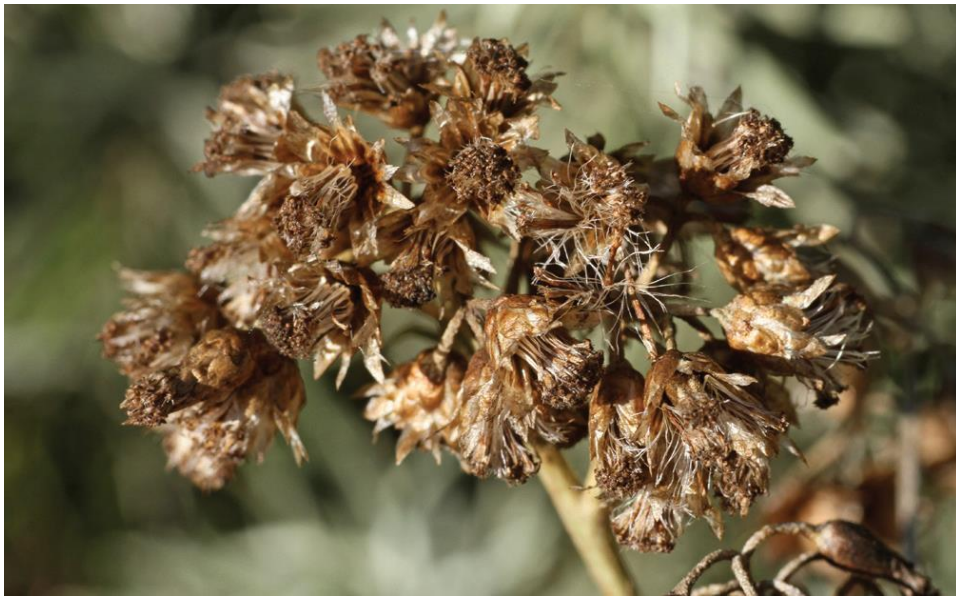
Slika 4: Plod primorskog smilja

Plod smilja je jednosjemena roška na čijem se vrhu nalazi kunadra, prilagodba u obliku rasperjanih dlaka koja služi rasprostranjivanju sjemenaka (Glavaš, 2019) (Slika 4).