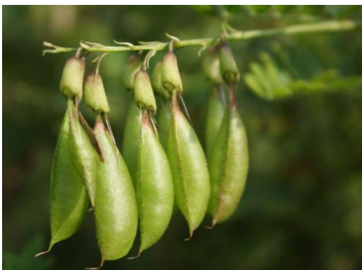
Slika 4. Plodovi mongolskog kozlinca