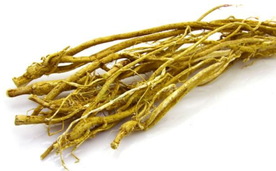
Slika 5. Korijen mongolskog kozlinca