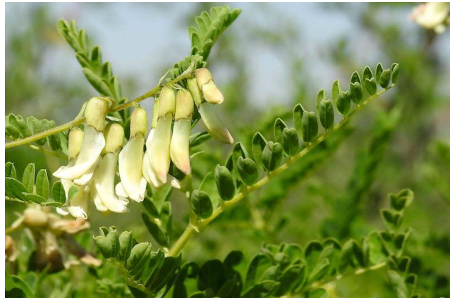
Slika 3. Cvjetovi mongolskog kozlinca (preuzeto s: www.herb-pharm.com )