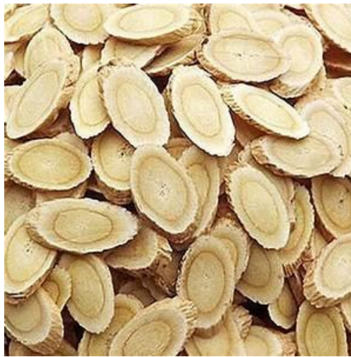
Slika 1. Astragali mongholicus radix

Korijen mongolskog kozlinca ( Astragali mongholicus radix ) ljekovita je biljna droga (Slika 1) koja potječe iz tradicionalne kineske medicine, a dobiva se od dvaju varijeteta biljne vrste Astragalus mongholicus Bunge iz porodice Fabaceae - A. mongholicus var. mongholicus (sin. A. membranaceus Bunge var. mongholicus (Bunge) P. K. Hsiao) i A. mongholicus var. dahuricus (DC.) Podlech (sin. A. membranaceus Bunge) (Zhu, 1998; EDQM, 2014).