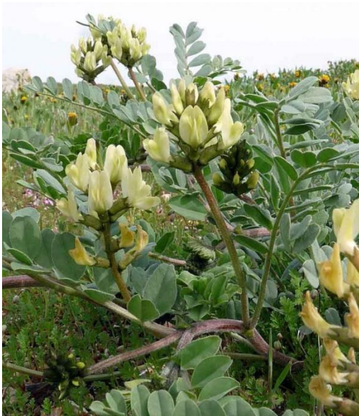
Slika 2. Astragalus mongholicus Bunge – mongolski kozlinac

Mongolski kozlinac višegodišnja je zeljasta biljka uspravne stabljike koja najčešće naraste 60-150 cm u visinu (Slika 2). Listovi su dugi 20-35 cm, neparno su perasti i sastavljeni od 25-37 liski eliptičnog oblika i duljine 3-6 cm. Liske su cjelovitog ruba, tupog vrha i peraste nervature, a za glavnu os lista su pričvršćene vrlo kratkom peteljkom. Pri bazi lista smješten je par trokutasto ovalnih ili lancetastih palistića šiljastog vrha. Stabljika i listovi prekriveni su sitnim mekim dlačicama bijele boje (McKenna i sur., 2002; WHO, 1999).