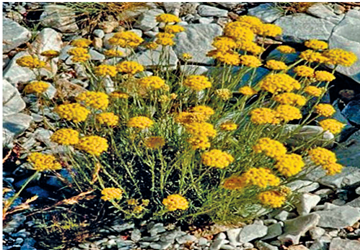
Slika 1. ◀ Mediteransko smilje ( Helichrysum italicum (Roth) G. Don.)

te posljedično učinak ovise o metodi pripreme ekstrakata (2, 3). Danas sve više raste interes farmaceutske i kozmetičke industrije za eteričnim uljem smilja zbog njegovih brojnih pozitivnih farmakoloških učinaka (4).