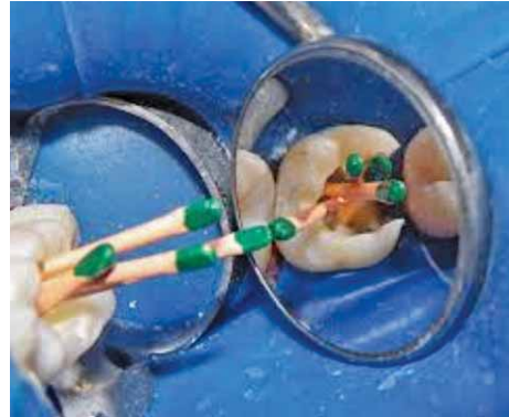
Slika 7. Punjenje korijenskih kanala s gutaperka štapićima (17)

U relevantnim istraživanjima kao najveći nedostaci gutaperke spominju se