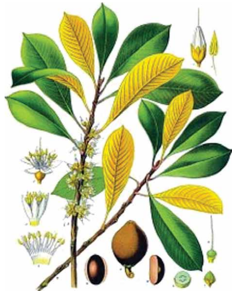
Slika 1. Palaquium gutta (Hook.) Burck (3)

Na Malajskom arhipelagu gutaperka se u sirovom obliku primjenjivala za izradu držaka noževa i različitih štapova. Prvi