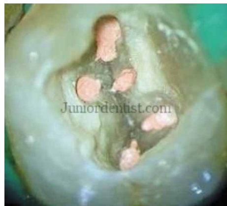
Slika 8. Prikaz završenog punjenja pri ulazu u korijenske kanale (19)