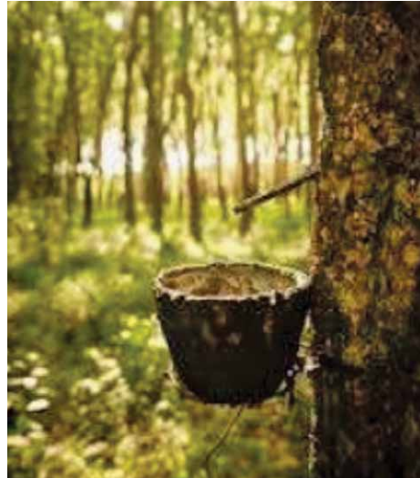
Slika 2. Dobivanje gutaperke (4)

Gutaperka je izdržala test vremena i dosad je najčešće rabljeni materijal u dentalnoj medicini. Rabi se od 1867. kada je Bowman izvjestio o njenoj mogućoj uporabi.