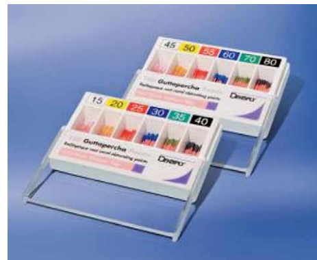
Slika 5. Klasični radioopakni gutaperka štapići različitih veličina za punjenje korijenskog kanala (11)