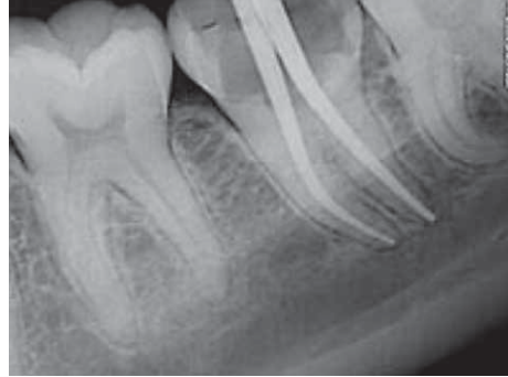
Slika 9. Prikaz radioopaknih gutaperka štapića nakon opturacije korijenskih kanala (23)

Novi sustavi za punjenje su zanimljivi i imaju potencijal, ali nedostaju istraživanja o njihovoj kliničkoj učinkovitosti i primjeni (22, 23).