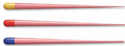
Slika 6. Standardizirani štapići gutaperke Pro Taper različitih veličina i oznaka prema bojama (12)