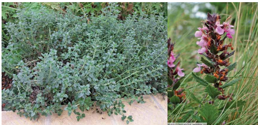
Slika 2. Teucrium chamaedrys L. (8, 9)

oblika, parno raspoređeni, 2–4 cm dugi, 1–2 cm široki, urezano narovašenog ruba. Izgledom podsjećaju na malene listove hrasta od čega potječe naziv biljke (grč. chamaedrys = mali hrast). Pricvjetni listovi su nalik na prave, ali su manji. Stabljike su krute, okrugle i obrasle mekanim dlakama, kao i plojke listova s objiju strana ili samo odozdo. Cvjetovi strše uspravno na dugim stapkama te su po 1 do 6 skupljeni u grozdaste, pršljenasto raspoređene cvatove. Čaška je dvousnata, cjevastozvonasta, često crvenoljubičastog preljeva i dlakava. Cvjetovi su dugi oko 1 cm, crvene boje, rjeđe bijeli. Vjenčić ima голу cijev i samo donju usnu koja je peterodijelna te izvana dlakava. Srednji je režanj okruglast, a postrani režnjevi su šiljati i uspravni (slika 2.). Plod je kalavac, jajoliki oraščić glatke površine, dug 1,5–2 mm, fino mrežast, s čvrstom priljubljenom ovojnicom i raspada se na četiri plodića. Cijela biljka je prekrivena mnogobrojnim žlijezdama što ju čini jako aromatičnom. Može cvasti od travnja do rujna, iako najljepše cvate u srpnju i kolovozu (1, 5, 6).