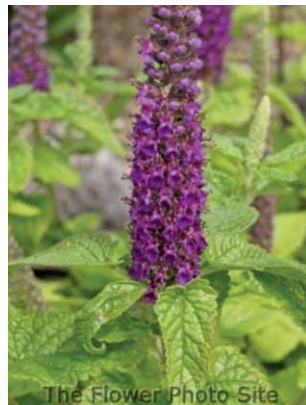
Slika 3. Teucrium halacsyanum Heldr. (12)

Vrsta T. halacsyanum raste na kamenitom tlu, a najviše je rasprostranjena na istočnom Sredozemlju, točnije na području Grčke i Egipta. Ova vrsta je jedna od zaštićenih endemskih biljnih vrsta Grčke (11).