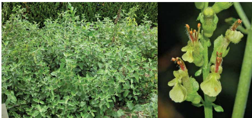
Slika 5. Teucrium scorodonia L. (16)

Vrsta Teucrium scorodonia L. (kaduljasti dubačac, lukovina, mali dubačac; engl. Wood sage ) je otporna vazdazelena trajnica, visoka 30–60 cm, s jednostavnim ovalno-srcolikim, izrazito narovašenim listovima blijedozele boje i mekane strukture. S donje strane su prekriveni dlakama, a rubovi su nazubljeni. Peteljke su duge do 1,5 cm, često i kraće. Ime biljke potječe od grčke riječi scorodonia što znači češnjak, jer listovi pri gnječenju, nespecifično za ostale Teucrium vrste, ispuštaju blagi miris češnjaka (5). Stabljika je četverobridna te pri dnu drvenasta, a ostatak je prekriven dlakama. Cvjeta ljeti, od srpnja do rujna. Cvjetovi rastu u do 15 cm dugačkom cvatu, zelenkastožute, a ponekad smeđe boje. Cvjetove čine 5 sraslih latica donje usne; gornje usne nema. Čaška je dugačka oko 5 mm, izbočene baze i dlakava kao i sam vjenčić. Ima četiri prašnika s uočljivim ljubičastim i dlakavim prašničkim nitima (slika 5.). Plod je suh, ali se ne raspada pri dozrijevanju (1, 15).