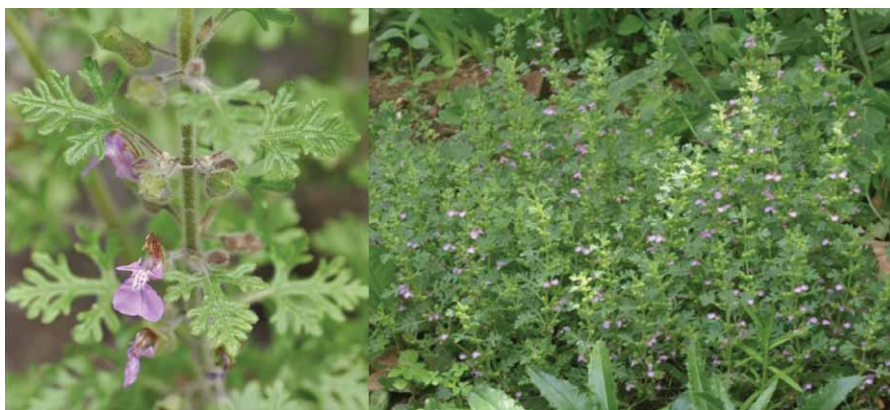
Slika 1. Teucrium botrys L. (3, 4)

Svoja Teucrium botrys L. (grozdasti ili crveni dubačac; engl. Cutleaf germander ) je jednogodišnja, rjeđe dvogodišnja biljka neugodna mirisa, s vretenastim, najčešće nepravilnim i zavijenim korijenom. Stabljike su jednostavne, uspravne, visoke 10–30 cm, četverobridne, prilično čvrste, zelene ili crvenkaste. Listovi su dugi 1,5–2 cm, od polovice oštro urezani, često duboko rascijepljeni na pet ili sedam dijelova. Cvjetovi su dugi 10–15 mm, po 2 do 4 skupljeni u cimozni cvat. Čaška je prilegla, žljezdasto dlakava, s 5 trokutastih zubaca, od kojih su gornja dva manja. Vjenčić je svijetlocrven, u sredini svjetliji, posut tamnim crvenoljubičastim mrljama (slika 1.). Plod je orašićić kuglasta oblika, 1,5–2 mm dug, hrapave površine. Cvate od srpnja do rujna (1, 2).