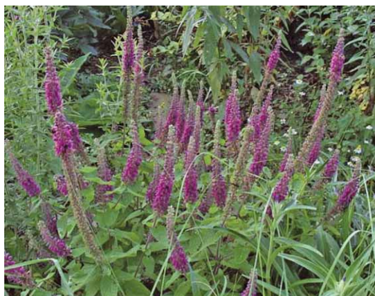
Slika 4. Teucrium hyrcanicum L. (14)

Vrsta T. hyrcanicum je višegodišnja biljka visine 60 do 80 cm. Listovi su joj pršljenasto položeni na kratkoj peteljci; duguljastojajasti su, zeleni, osim naličja koje je sivkasto zbog sitnih dlačica kojima je prekriveno. Čaška cvijeta je dvousnata. Gornja usna čaške je široka s jajolikim središnjim zupcem i dva bočna zupca. Bočni zupci gornje usne pokrivaju zupce donje usne. Vjenčić je tamnoljubičast s 5 nazubljenih latica koje izgledaju jednousnate. Plodovi vrste T. hyrcanicum su 4 duguljasta oraščića (slika 4.) (13).