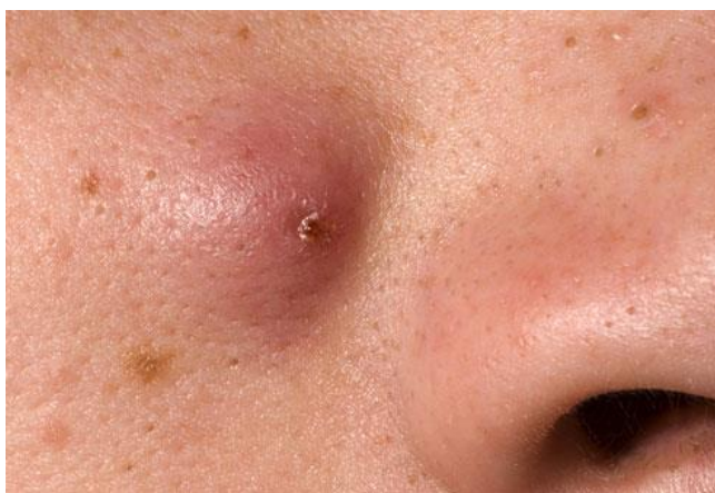
Slika 5. Nodul

Nodul (čvorić) nastaje kao produkt dublje upalne infiltracije. Predstavlja najteži oblik akni (Slika 5.). To je mekana, ali čvrsta lezija, promjera 5 mm ili više. U dermisu može biti gnojna ili hemoragična, može obuhvatiti i susjedne folikule te se proširiti do masnih stanica.