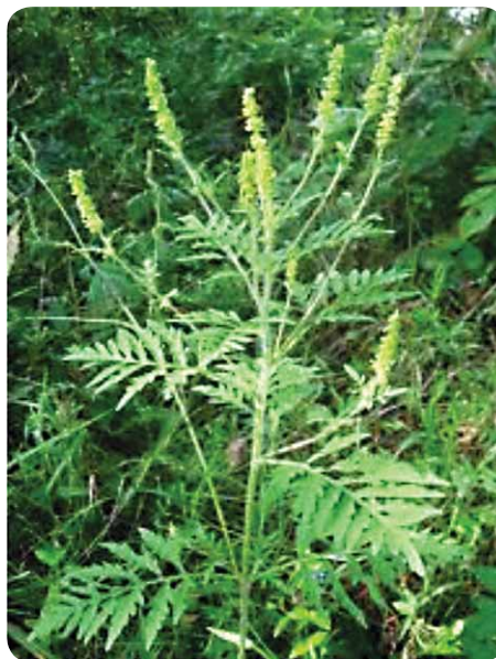
Slika 2. Ambrozija

Iako su uzroci alergija brojni i različiti, mehanizmi alergijskih reakcija su gotovo jednaki. Za većinu osoba potpuno bezopasne tvari u alergičnih će osoba izazvati burnu imunosnu reakciju. Svaka molekula koju mogu prepoznati i na koju reagiraju mehanizmi stečene imunosti jest antigen. Kako bi se reakcija do koje je došlo zvala alergijskom, alergen koji ju je izazvao mora biti poznat, mora biti dokazana veza između dodira s antigenom i pojave oštećenja i mora se otkriti mehanizam nastanka oštećenja.