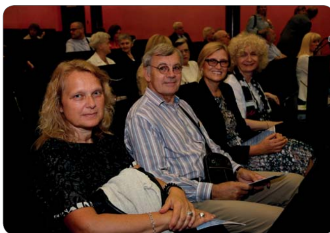
Slika 8. Unuka i njezin suprug (u sredini) te praunuke (krajnje lijevo i krajnje desno)

Skup je privukao veliki broj zainteresiranih, a nazočili su mu i potomci Frana Bubanovića (slika 8.).