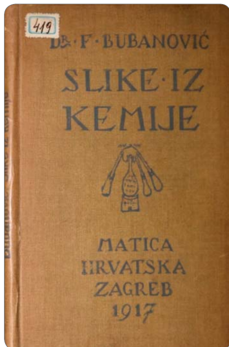
Slika 2. Knjiga Slike iz kemije