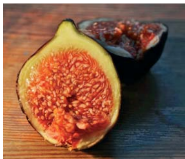
Slika 9. ► Plod smokve – Ficus carica L. (5)

Smokva je jednodomno listopadno stablo iz porodice dudova (Moraceae). Naraste do 10 metara visine. Široke je krošnje. Ima vrlo razvijene, duge i slabo razgranate grane. Korijenov sustav je dobro razvijen. Deblo je promjera do 1,5 m, kora je siva i glatka, mladi izbojci su maslinastozeleni i prekriveni lenticelama. Vršni pupovi su jajoliki, dugo ušiljeni, imaju 2–3 zelenkastosive ljuske dok su bočni pupovi okruglasti s više ljusaka. Listovi su naizmjenični, rastu na vrhovima grana na peteljci dugoj 3–6 cm, jednostavni su, veliki 10–25 cm, duboko usječeni čime su podijeljeni na 3–5 režnjeva. Pri osnovici su srcasti ili ravni, na rubovima cjeloviti,