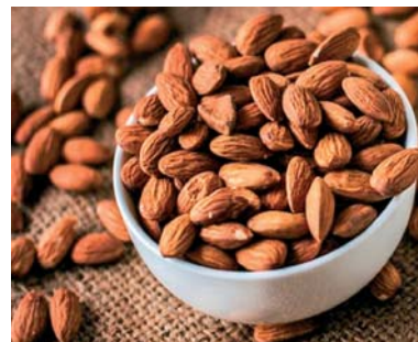
Slika 2. ► Sjemenke badema – Prunus amygdalus ((Mill.) D.A.Webb) (5)

U prehrani se rabe suhe, jestive sjemenke badema, listopadnog stabla iz porodice ruža ( Rosaceae ). Po opisu badem je do 10 metara visoko drvo i tvori široku, piramidalnu krošnju. Korijenov sustav je jak i dubok. Deblje je do 30 cm u promjeru, kora je u mladosti glatka i sivozelena, kasnije postane svijetlosiva i ljuškava. Grane su gole i bez trnova. Listovi su smješteni naizmjenično, a nalaze se na peteljci dugoj 2–3 cm; plojke su dužine 10–12 cm, ušiljenih vrhova i nazubljenih rubova. Cvjetovi su pojedinačni, dvospolni pravilni, promjera do 2 cm. Građeni su od čaške koju čine pet zelenih lapova i vjenčića od pet latica bijele ili nježno ružičaste boje. Prašnici su mnogobrojni. Badem cvjeta prije listanja već i zimi, u siječnju i veljači. Plod je sivozelena dlakava koštunica, obavijena je usplodem koje se otvori kada u jesen dozrije te otkriva tvrdu, ali glatku smeđu ljusku koja je prekrivena s puno malih rupica. Unutar nje nalazi se gola 1,5–3 cm duga, spljoštena sjemenka smeđe ovojnice (slika 2.). Badem raste na području Srednjeg