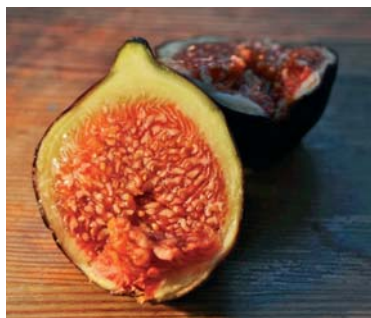
Slika 9. ► Plod smokve – Ficus carica L. (5)

Smokva je jednodomno listopadno stablo iz porodice dudova (Moraceae). Naraste do 10 metara visine. Široke je krošnje. Ima vrlo razvijene, duge i slabo razgranate grane. Korijenov sustav je dobro razvijen. Deblo je promjera do 1,5 m, kora je siva i glatka, mladi izbojci su maslinasto-zeleni i prekriveni lenticelama. Vršni pupovi su jajoliki, dugo ušiljeni, imaju 2–3 zelenkastosive ljuske dok su bočni pupovi okruglasti s više ljusaka. Listovi su naizmjenični, rastu na vrhovima grana na peteljci dugoj 3–6 cm, jednostavni su, veliki 10–25 cm, duboko usječeni čime su podijeljeni na 3–5 režnjeva. Pri osnovici su srcasti ili ravni, na rubovima cjeloviti,