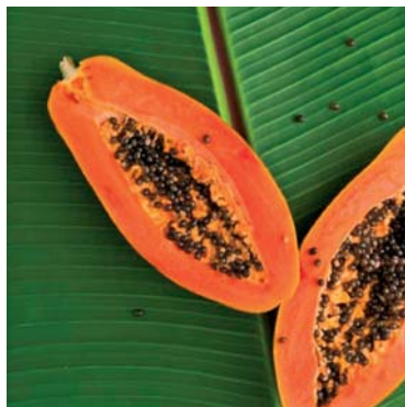
Slika 6. ► Plod papaje – Carica papaja L. (5)

U prehrani se primjenjuje zreli plod papaje, drvenaste biljke koja raste kao vazdazeleno, često slabo razgranjeno drvo. Donji dio stabla je bez listova, gdje se razvijaju plodovi. Listovi su veliki, 50–70 cm u promjeru, duboko usječeni, sedmerostruki. Plodovi su joj dugi 15–45 cm i promjera od 10–30 cm (slika 6.). Papaja potječe iz centralnog dijela Amerike, ali se danas mnogo kultivira širom svijeta. Postoji 45 poznatih vrsta papaje. Plod papaje je velik i teži od 0,5 do 2 kg, a po obliku može biti okruglast, cilindričan ili kruškolik, ovisno o vrsti. Vanjski dio ploda je obično zelenkast ili