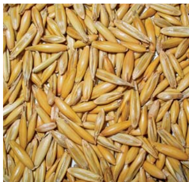
Slika 11. ► Zrna zobi – Avena sativa L. (5)

Zob je važna žitarica za ljudsku prehranu. Upotrebljavaju se zrna zobi (slika 11.) iz osušenih sjemenaka – izduženog zrna, obavijenog pljevom koje ne srastu skupa sa zrnima. Zrno se odvaja od pljeve i dalje obrađuje ili samo tako suši. Po opisu zob je jednogodišnja zeljasta biljka iz porodice trava (Poaceae). Stabljika joj je uspravna, gola, šuplja, naraste do 1,5 m visine i razvija do 2 metra dugo korijenje. Listovi su tanki, goli, na rubovima hrapavi, široki do 15 mm i plavo-zelene su boje, s rukavcima koji obuhvaćaju vlat. Na prijelazu rukavca u plojku lista vidljiv je kratki jezičac čije uške nisu razvijene. Cvjetovi su dvospolni, na vrhu stabljike skupljeni u metlice koje stvaraju klasove zrna. Klasići su viseći, sastavljeni od dvije pljeve. Tučak ima nadraslu plodnicu i jedan sjemeni zameetak, prašnika je tri. Cvate od svibnja do srpnja. Biljka je zelenkasta dok zrenjem postaje zlatnožuta. Latinski naziv roda Avena L. bio je naziv za kulturnu i samoniklu zob kod Rimljana. Zabilježeno je da dolazi od sanskriptske riječi avi (ovca) ili avasa (hrana) ili od latinske riječi advena (došljak, tuđinac) prema čemu su Kelti upoznali zob preko Germana. Uzgaja se sijanjem sjemenaka u proljeće u dreniranu kompostnu zemlju na sunčanom mjestu. Dobra predkultura su joj mahunarke i krumpir. U planinskom području uzgaja se jara sorta, dok se u nizinskom obično sije na jesen – ozima zob. U pučkoj medicini primjenjuju se zrna zobi za liječenje kožnih bolesti i snižavanje kolesterola (16).