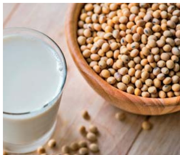
Slika 10. ► Sjemenke soje – Glycine max (L.) Merr. (5)

Soja je također jednogodišnja zeljasta biljka iz porodice mahunarki (Fabaceae). Uzgaja se kao ratarska kultura radi sjemenaka pomoću kojih se i razmnožava. Ovisno o sorti naraste do 2 metra visine. Uspravna je i razgranata, cijela je prekrivena izraženim dlačicama. Dugačkog je korijena (do 150 cm), razgranatog i dobro razvijenog. Na dugim dlakavim peteljka ima trodjelne listove, eliptičnih liski, s malenim palistićima pri dnu. U pazušcima listova razvijaju se dvospolni, nepravilni, mali cvjetovi, skupljeni po 2–8 u grozdaste cvatove. Ocvijeće je dvostruko, a čine ga zvonasta čaška koja ima pet zubaca i vjenčić bijele ili ljubičaste boje. Tučak