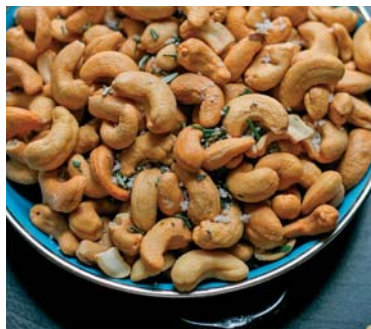
Slika 4. ► Sjemenke indijskog oraščića – Anacardium occidentale L. (5)

Indijski oraščić nije samo ukusna, nego hranjiva i zdrava namirnica, koju vrijedi redovito rabiti zbog dobrobiti, koje donosi za zdravlje. Sadrži puno manje masti od ostalih orašastih plodova. Dvije trećine masti u indijskom oraščiću su nezasićene masne kiseline. 75 % tih nezasićenih masnih kiselina čini oleinska kiselina (nju sadrži i maslinovo ulje) poznata po blagotvornom utjecaju na zdravlje srca. Indijski oraščić je odličan izvor antioksidansa te tako povezano štiti od nastanka bolesti krvožilnog sustava, sive mrežnice, raka, bolesti zglobova i brojnih drugih poremećaja zdravlja. Vrijedan je izvor bakra i magnezija (10).