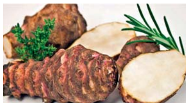
Slika 3. ► Gomolji čičoke – Helianthus tuberosus L. (7)

U prehrani se primjenjuju gomolji čičoke (slika 3.), te mladi listovi i izdanci čičoke, trajne zeljaste biljke iz porodice glavočika (Asteraceae). Uspravne je i dlakave stabljike, u gornjem dijelu razgranate; naraste vrlo visoko, čak i preko 3 metra. Gomolji pod zemljom izgledom su vrlo nalik malom đumbiru. Listovi su izduženi, na vrhu ušiljeni te obrasli dlačicama, nalaze se na kraćim peteljka; u donjem dijelu biljke su nasuprotni, u gornjem dijelu naizmjenični. Cvjetne glavice su pojedinačne, velike 4–8 cm, nalaze se na vrhovima stabljike i bočnih izbojaka. Građene su od središnjih cjevastih i rubnih jezičastih cvjetova. Ima 5 prašnika, prašnice su međusobno srasle i prirasle za vjenčić. Tučak je podrasli, građen od dva plodnička lista. Čičoka cvate u rujnu i listopadu. Plod je roška. Blizak je srodnik suncokreta ( Helianthus annuus L.). Podrijetlom je iz Sjeverne Amerike, danas je udomaćena u Europi, Africi,