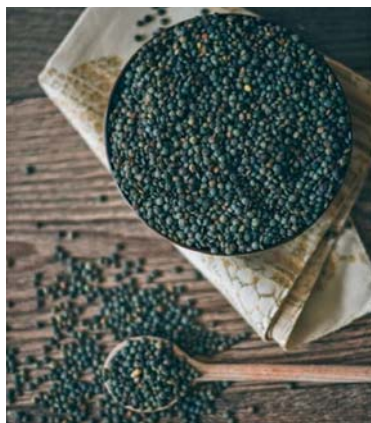
Slika 5. ► Sjemenke leće – Lens culinaris Medik. (5)

Leća je jednogodišnja zeljasta biljka iz porodice mahunarki (Fabaceae), razgranate, uspravne ili češće polegnute stabljike, visine do 40 cm, plitkog korijenja. Listovi su naizmjenični, parno perasti, sastavljeni od 2–8 ovalnih lisaka koje su na kratkim peteljka, a završavaju s jednostavnim ili razgranatim viticama. Cvjetovi su dvospolni, nepravilni, mali i jedva uočljivi, no lijepog izgleda. Rastu na dugim stapkama u pazušcima listova s gornje strane. Dvostrukog su ocvijeća, čaška ima pet zubaca, dok je vjenčić nalik leptiru, bijele do nježno svijetloplavkaste boje. Tučak ima nadraslu plodnicu, prašnika je deset, a devet ih je sraslo u cijev. Cvjeta od svibnja do srpnja, najprije na dnu pa postupno prema vrhu stabljike. Plodovi su spljoštene mahune koje sadrže 1–2 okrugle, plosnate male sjemenke (slika 5.).