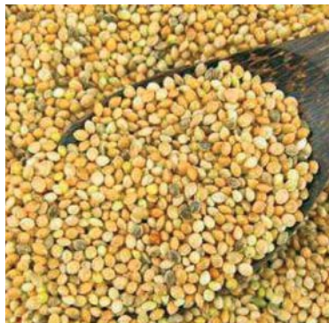
Slika 7. ► Sjemenke prosa – Panicum capillare L. (5)

U prehrani se primjenjuju sitne sjemenke prosa, jednogodišnje biljke iz porodice trava (Poaceae). Jedna biljka proizvede 10 000 – 12 000 sjemenaka u sezoni. Stabljika prosa je uspravna ili uzdignuta, razgranata, dlakava, naraste do 60 cm visine. Listovi su lancetasti, dugi 10–30 cm, široki 5–15 mm. Cvjetovi su mali, skupljeni po dva u klasiće duge oko 2 mm, a svaki klasić ima jedan sterilni i jedan fertilni cvijet. Klasići su skupljeni u metličaste i bogato razgranate cvatove do 40 cm. Proso cvate od lipnja do rujna. Cvatovi su vrlo dekorativni te se biljka kultivira kao ukrasna za suhe cvjetne