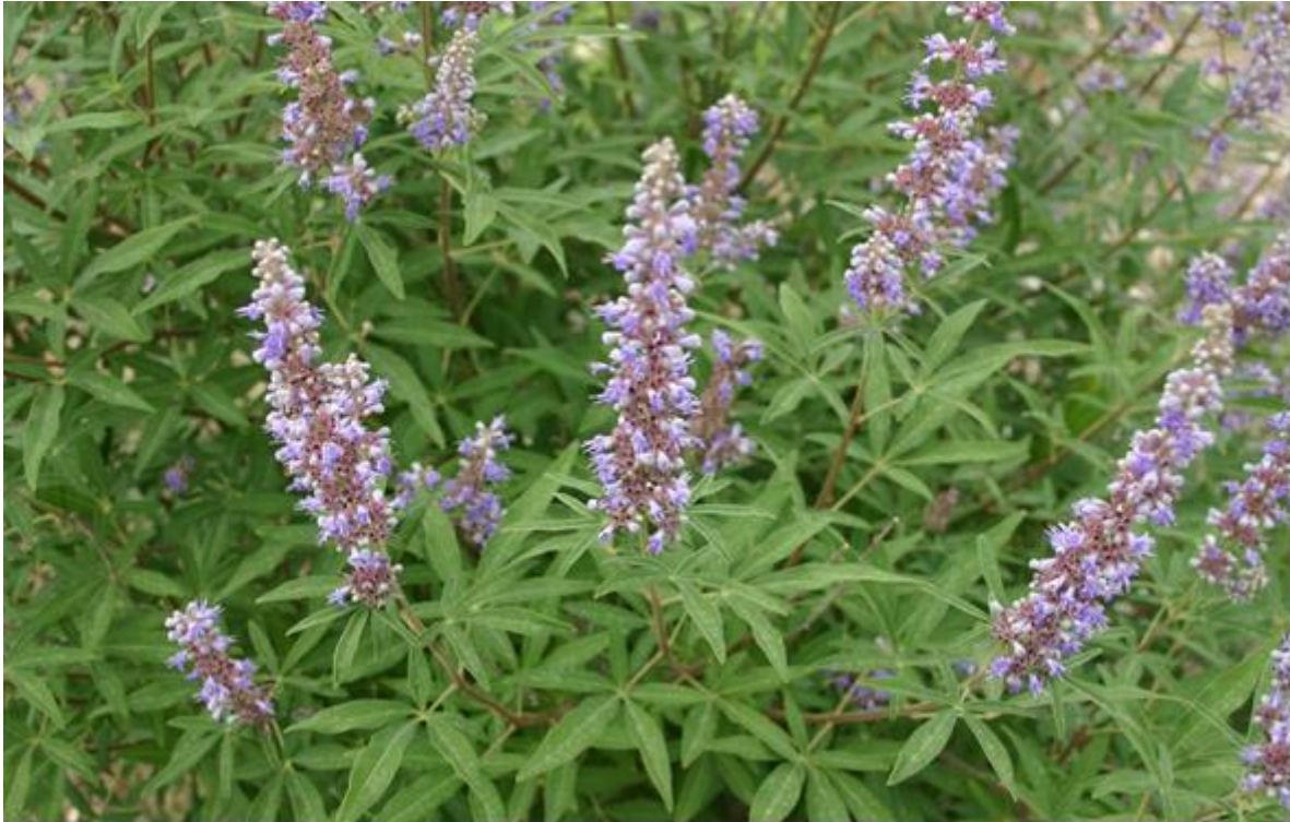
Slika 1. Konopljika ( Vitex agnus-castus L.) ( https://hr.wikipedia.org )