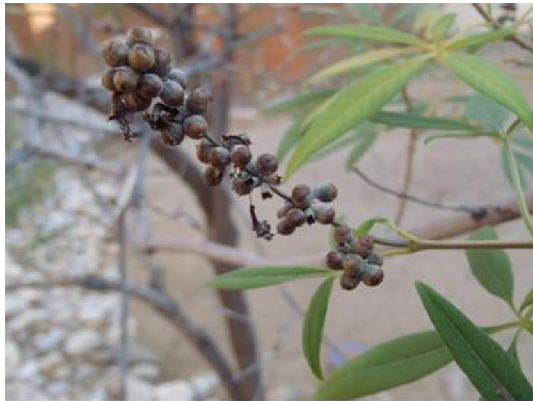
Slika 2. Konopljika u razdoblju stvaranja plodova