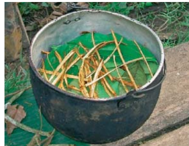
Slika 1. ► Biljni materijal za pripremu ayahuasce u kotlu (6)