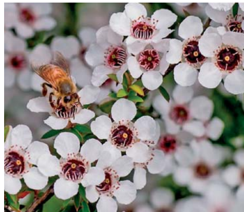
Slika 2. ▶ Medonosna pčela ( Apis mellifera L.) na cvijetu manuke (5)

Neovisno o njegovom podrijetlu, med je smjesa bioaktivnih tvari koje uključuju ugljikohidrate (većinom fruktozu i glukozu), proteine, aminokiseline, organske kiseline, vitamine, enzime, minerale i ostale sastavnice proizašle iz biljnih izvora poput fenolnih spojeva, a sadrži i ostale manje značajne sastavnice koje pridonose složenosti kemijskog sastava meda (6). Kako bi se odredilo biljno podrijetlo meda,