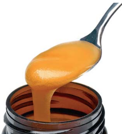
Slika 4. ► Manuka med (14)

Med je prirodni proizvod čija je dobrobit na ljudsko zdravlje poznata već tisućama godina, sežući od starog Egipta do danas, za kojeg literatura navodi vrlo široku lepezu primjene (6, 13). Danas su u središtu pozornosti sorte meda koje se mogu primjenjivati u medicinske svrhe, među kojima se intenzivno istražuju učinci manuka meda i tualang meda (malezijski multifloralni med) (8). Vrijednost manuka meda (slika 4.) ogleda se u njegovom antibakterijskom djelovanju te antioksidacijskoj sposobnosti, a također i u njegovom pozitivnom učinku u liječenju rana, koji je dobro poznat još od davnina (7).