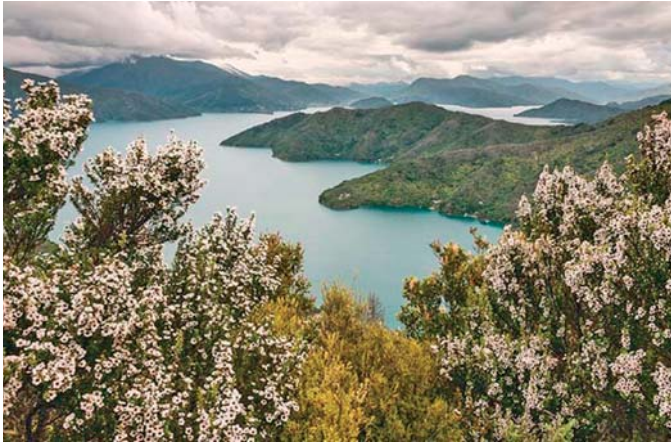
Slika 1. ◀ Vrsta Leptospermum scoparium J. R. Forst. & G. Forst. u cvatu na Novom Zelandu (4)

na Novi Zeland. Danas je najraširenija drvenasta vrsta Novog Zelanda, osobita po tome što veoma dobro podnosi široki raspon okolišnih uvjeta te stoga čini vrlo važnu sastavnicu ekosustava (2). Pojavljuje se na različitim staništima sve od morske razine pa do iznad 1600 m n.v. (slika 1.).