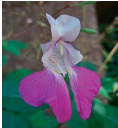
Slika 2. ► Cvijet vrste I. balfourii