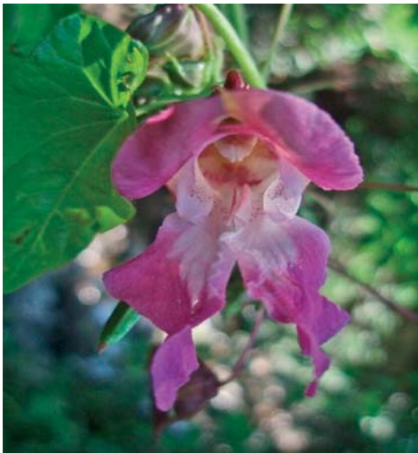
Slika 1. ► Cvijet vrste I. glandulifera

Učinak na modelu boli je izostao uz usporednu primjenu naloksona što upućuje na uključenost opioidnog sustava, dok je anksiolitički učinak povezan s utjecajem ekstrakta na monoaminske neurotransmitere i moždane čimbenike rasta (5). Jedan od flavonoida, amelopsin, odnosno dihidromiricetin, pronađen u cvjetovima vrste I. glandulifera , klinički se ispituje zbog utjecaja na kontrolu glikemije, inzulinske otpornosti te izlučivanje inzulina u bolesnika s dijabetesom tipa 2 (6). Osim spomenutih fenolnih spojeva, za svojite roda Impatiens karakteristični bioaktivni spojevi su naftokinoni, polisaharidi te saponini (7). Cilj ovog rada bio je odrediti polifenole, flavonoide i antioksidativni učinak ekstrakata listova i cvjetova vrsta I. glandulifera i I. balfourii .