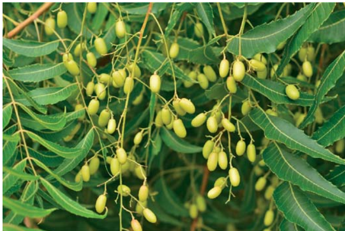
Slika 2. ► Žute koštunice nima bogate uljem (8)

upućuje na osobitu složenost kemijskog sastava ove vrste, u kojem se među sekundarnim metabolitima posebno ističu brojni triterpeni (9) koji su odgovorni za mnoga farmaceutska djelovanja te insekticidno djelovanje nima (10). Do sada je određeno i izdvojeno preko 150 tetranortriterpena (limonoida) iz različitih dijelova ove biljke (10).