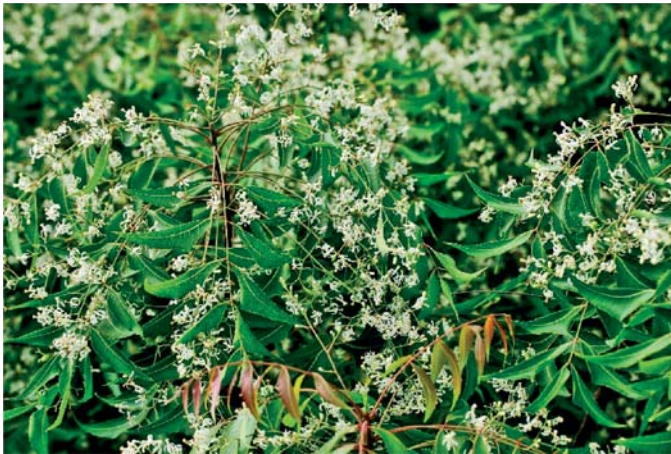
Slika 1. ◀ Vrsta Azadirachta indica A. Juss. u cvatu (7)

Vrsta A. indica je tropska vazdazelena vrsta drveća iz porodice Meliaceae (4), premda u sušnijim područjima na kratko vrijeme može i potpuno ostati bez listova (3). Ova je porodica inače poznata po vrlo cijenjenom drvu mahagonija koje se dobiva iz vrsta pojedinih rodova (6). Ime roda Azadirachta A. Juss. vuče podrijetlo iz perzijskog naziva ove vrste koji glasi »Azadarakhat« (perz. aza = gorak, drakhat = drvo) (3).