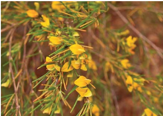
Slika 1. ◀ Stabljike vrste A. linearis s igličastim listovima i leptirastim cvjetovima (9)

Stabljika ove grmolike mahunarke već se pri tlu dijeli u brojne tanke izdanke koji nose igličaste žarkozelene listove, duge od 4 do 10 cm (slika 1.), a može narasti do 1,5 m visine. Karakteristični leptirasti cvjetovi žute boje pojavljuju se u rano ljeto, a kao plod nastaje jednosjemena mahuna. Vrlo dobro uspijeva na krupnozrnatim kiselim tlima koja su siromašna hranjivim tvarima, a odgovara joj klima s vrućim i sušnim ljetom (1).