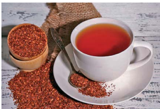
Slika 5. ◀ Šalica rooibos čaja (23)

Pravilno pripravljen rooibos čaj može značajno pridonijeti dnevnom unosu polifenola i ukupnom antioksidacijskom kapacitetu. Jedno istraživanje potvrdilo je da najveći udio polifenola i najveći antioksidacijski kapacitet ima šalica fermentiranog rooibosa u vrećicama (1 vrećica ~ 2,6 g/180 mL kipuće vode) koje se natapaju barem 10 minuta, a može i dulje, s obzirom na to da nakon 20 ili 30 minuta natapanja nije došlo do značajnih promjena u sastavu. Dodatak mlijeka fermentiranom rooibosu ne umanjuje bioraspoloživost antioksidansa iz čaja, a kako bi se postigle dobrobiti na zdravlje, preporuča se uzimanje barem 6 šalica rooibos čaja dnevno (slika 5.) (20).