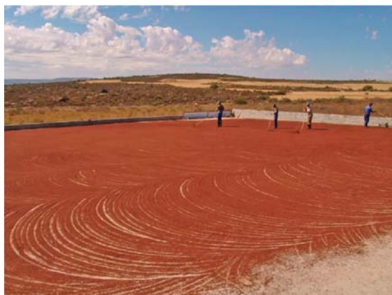
Slika 3. ► Sušenje fermentiranog rooibosa (11)

završni sigurnosni korak prije pakiranja biljnog materijala još se primjenjuje postupak sterilizacije zbog zabilježenih slučajeva onečišćenja vrstama roda Salmonella (1, 2).