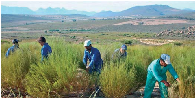
Slika 2. ► Berba rooibosa (10)

Pri tome dolazi i do promjene boje biljnog materijala iz zelene u karakterističnu crvenkastosmeđu, a zatim se rasprostire te suši na suncu kako bi se razvila aroma (slika 3.). Čaj pripravljen od fermentiranog rooibosa ima blago slatkasti okus s jedva primjetnim stežućim učinkom, a u aromi prevladavaju medene, drvenaste i biljnocvjetne note (1, 2, 6).