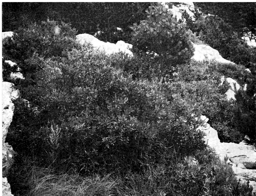
Sl. 2. Sibiraea croatica Degen u šumi crnog bora iznad Babrovače.