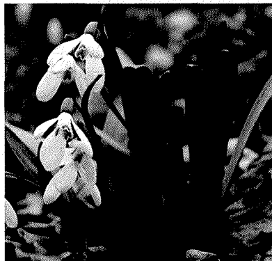
Slika 3. Galanthus caucasicus

Galantamin ispoljava svoje djelovanje putem nekoliko mehanizama. On je selektivni