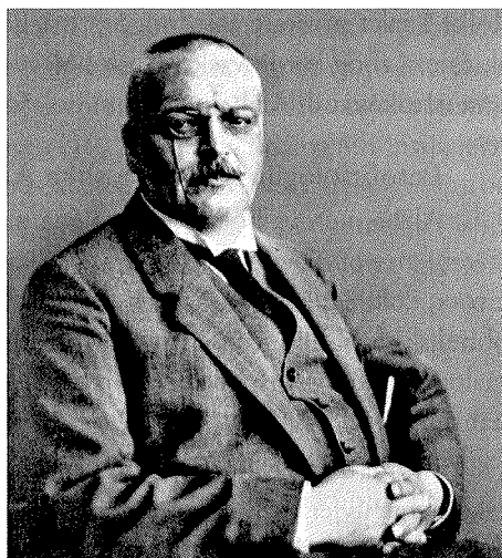
Slika 1. Alois Alzheimer

Pacijentica je u bolnicu primljena zbog neobičnih promjena ponašanja i smanjene mogućnosti kratkoročnog pamćenja. Nakon njezine smrti, 1906., izvršena je autopsija te je u mozgu otkriven niz patoloških promjena uključujući skupljanje korteksa, te stvaranje patoloških nakupina proteina u i izvan živčanih stanica. Alzheimer je nove spoznaje i rezultate predstavio medicinskoj javnosti, dok je Emil Kraepelin, jedan od njegovih suradnika, 1908. u knjizi Psihijatrija prvi put spomenuo naziv »Alzheimerova bolest« (2).