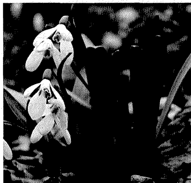
Slika 3. Galanthus caucasicus

Galantamin ispoljava svoje djelovanje putem nekoliko mehanizama. On je selektivni