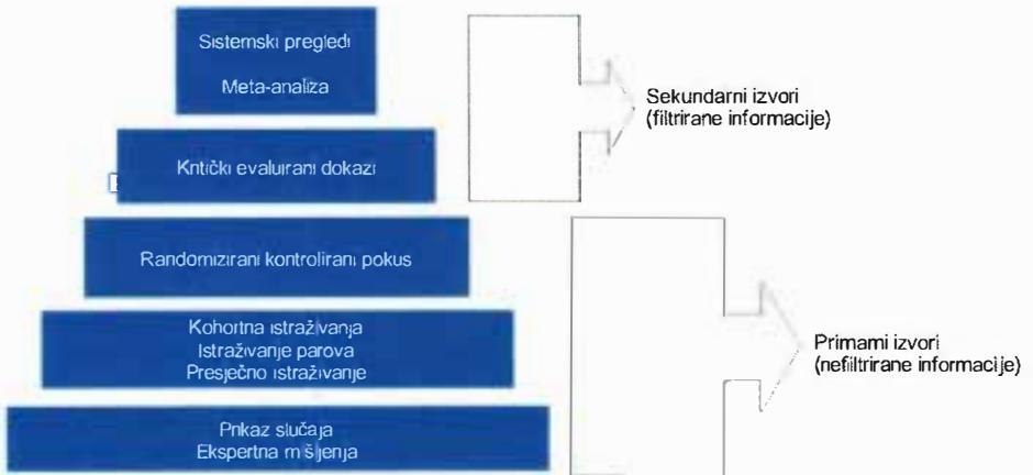
Slika 2. Hijerarhija dokaza (objašnjenje pojmova vezano uz sliku 2.)